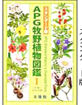
『APG 牧野植物図鑑』 ソネット科・オトギリソウ科 スタンダード版 牧野 富太郎/著 邑田 仁/監修

今も多くの方に活用されている『原色牧野日本植物図鑑』をはじめ、図鑑・伝記と牧野氏に関連した多数の所蔵があります。この機会に、身の回りの植物に改めて目を向けてみませんか?