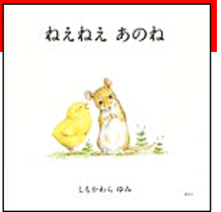
『ねえねえあのね』 講談社 しもかわら ゆみ/作