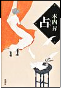
『占』 新潮社 木内 昇/著