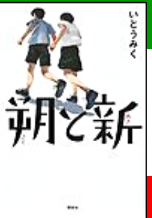
『朝と新』 講談社 イトウ ミク/著