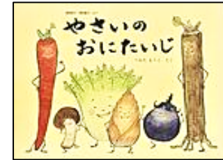
『やさいのおにたいじ』 福音館書店 つるた ようこ/作