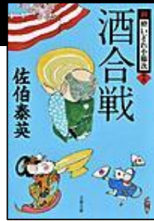
『酒合戦』 文藝春秋 佐伯 泰英/著