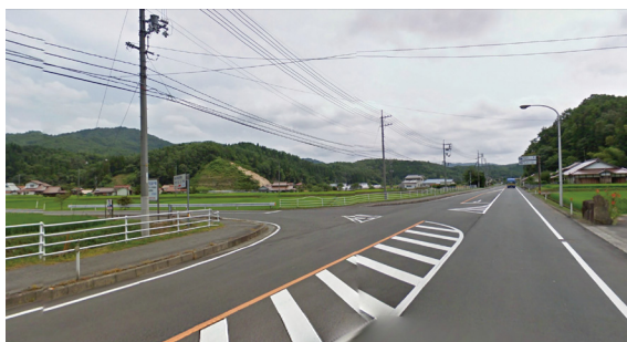
02 (豊平分岐 田園の誘導ポイント)