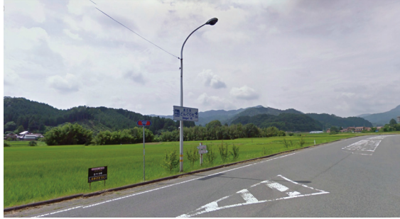
T1 (国道 433 号 田園の誘導ポイント)