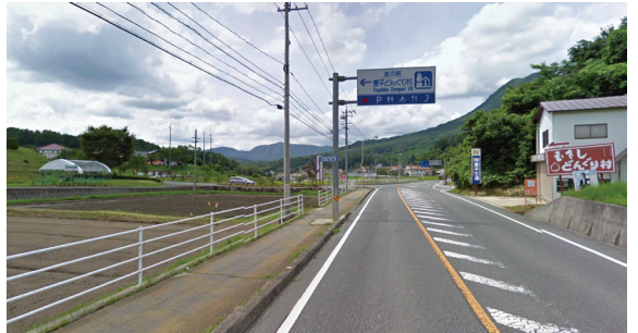
T7 (道の駅豊平どんぐり村 総合案内、周辺案内サイン)