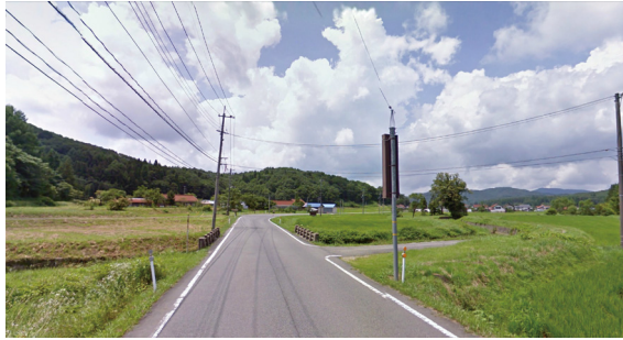
Y1 (県道307号 田園のゲート)