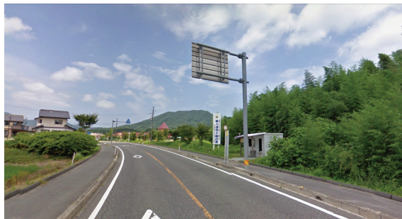
04 (わさ〜る産直館 総合案内、周辺案内サイン)