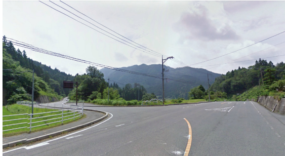
T3 (国道 433 号 田園の誘導ポイント)