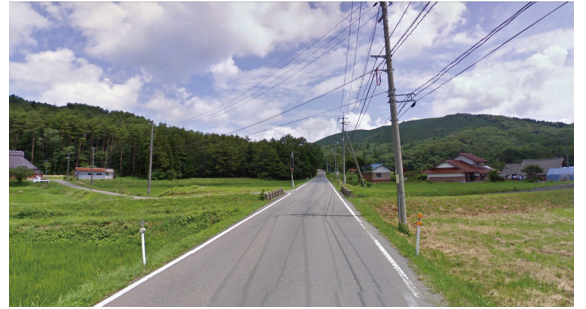
Y2 (県道307号 田園の誘導ポイント)