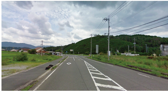
06 (県道79号 田園のゲート)