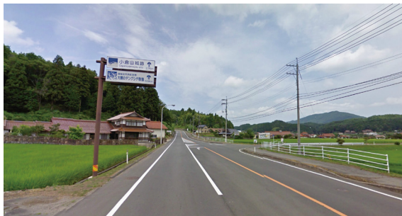
01 (国道 261 号 八栄神社の大ヒノキ等の誘導ポイント)