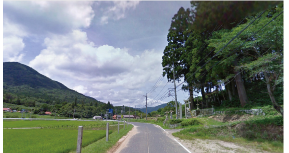
T4 (県道 313 号 田園の社)