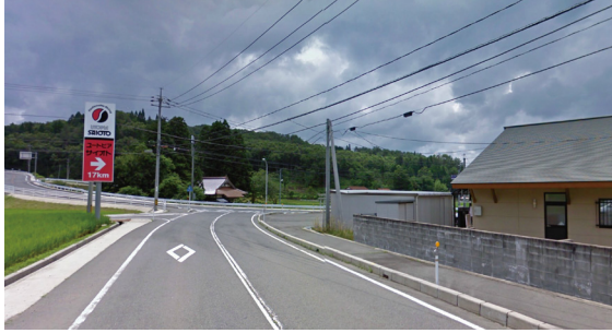
G1 (田園の社、田園の誘導ポイント)