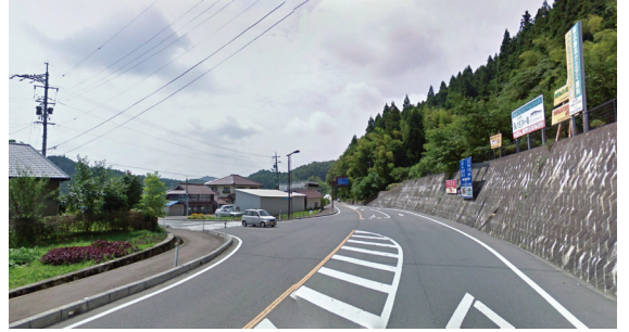
T5 (国道 433 号 田園の誘導ポイント)