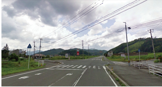
05 (県道79号 大朝のテングシデ群落、田原温泉5000年風呂等 田園の誘導ポイント)