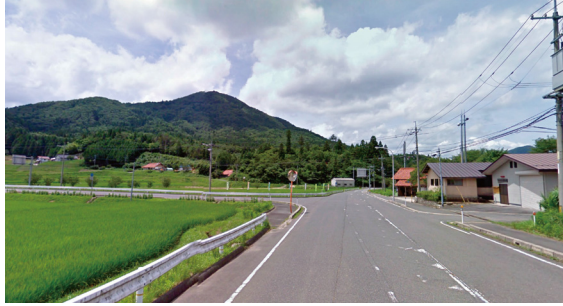
T4 (豊平 田園の誘導ポイント)