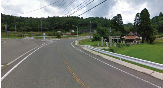
G2 (国道 186 号 田園の誘導ポイント)