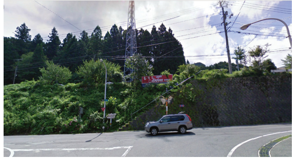
T2 (国道 433 号 田園の誘導ポイント)