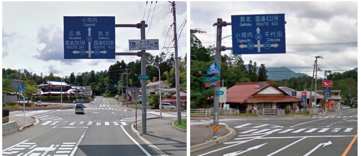
例)旧芸北町、旧千代田町の表記が残っている町道の108系道路案内標識→いずれ近傍の字名に変わる

現在あるほぼすべての道路案内標識(主に幹線道路と町道上にある標識)には旧4町の町名がそのまま残っている。これは道路案内標識の原則からは外れており、今後各標識がメンテナンス時期になると原則に則り、近傍の字名へと表示が見直されていく予定である。しかし、旧町名は実際には多くの固有名詞に使われていたり、また町内外の人々にとって町内における大体の場所の把握と理解を深めるうえでは有効に働いている。この実情を踏まえ、本計画ではこの旧町名を地域名として位置づけ、総合案内サインや周辺案内サインにエリア名として表示することとする。 (※ただし、過渡期であるがゆえの対処として考え、今後旧町名の必要性については継続的に協議を行うこととする)