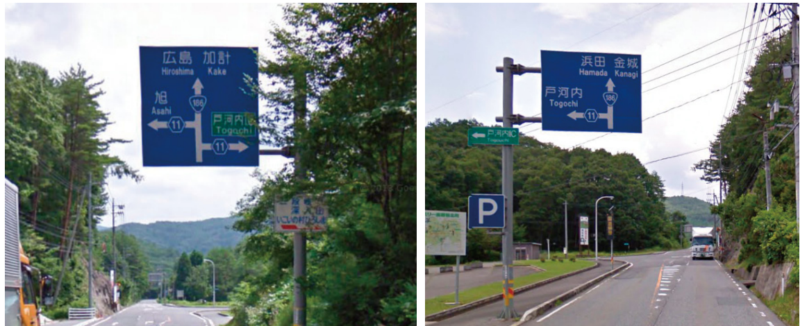
例)芸北～松原分かれの交差点の道路案内標識 — すべての表記が北広島町外の地名になっている

サイン計画として町内の観光案内誘導を考える際に、114系の著名地点案内は当然検討すべきこととして挙げられるが、道路交通のベースとなる108系標識においても観光案内に関連する地名が表記されることで、よりわかりやすい円滑な誘導が実現できると考えられる。しかし道路には一つの場所へ導くという以前に広域誘導という重要な役割を担っている。そのため、主要幹線道路上の108系標識に北広島町内の地名を表示させるためには、これから長い時間をかけて広域の交通網における拠点であると認められる必要があると考えられる。そういった点からも、まずは広島県が進める観光サイン整備計画と連携し114系標識の充実を図ることが大切である。