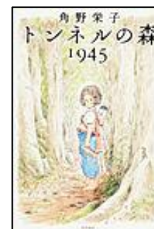
『トンネルの森 1945』 (角野 栄子 著/KADOKAWA)