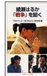
『綾瀬はるか「戦争」を聞く』 岩波書店 TBSテレビ 『NEWS23』 取材班 編

あの日も当たり前の生活を送っていた人々がいたことを思いながら、本を通して平和について考えてみてはどうでしょうか。