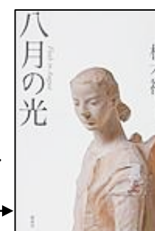
『八月の光』Flash in August (朽木 祥 作/偕成社)