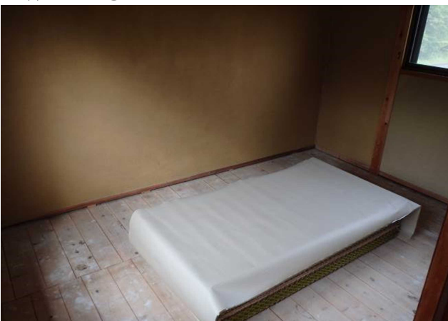
○2階和室① (入居時に畳を敷きます)