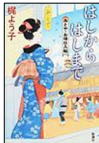
『はしからはしまで』 (みとや・お瑛仕入帖3) 新潮社 梶 よう子/著