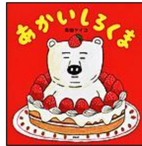
『あかいしろくま』 PHP研究所 柴田 ケイコ/作・絵

『ドラゴンのお医者さん』 ジョン・プロクター は虫類を愛した 女性 岩崎書店 パトリシア・バルデス/文 フェリシタ・サラ/絵