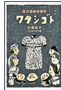
『ワタシゴト』 14歳のひろしま 汐文社 中澤 晶子/作 ささめや ゆき/え