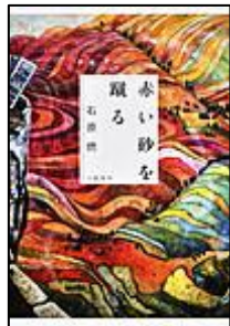
『赤い砂を蹴る』 文藝春秋 石原 燃/著