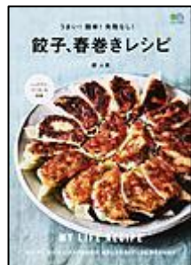
梶出版社 うまい! 簡単! 失敗なし! 『餃子、春巻き レシピ』 堤 人美/著

餃子や春巻きなどの 具は、自由自在にアレ ンジできます。調理の 仕方も様々。いろい ろな餃子や春巻きに挑 戦してみたいかどう しょうか?! 包み方や餃 子のたれのバリエーシ ョンも掲載されていま す。今からの時期おす めです。