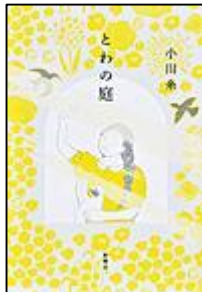
『とわの庭』 新潮社 小川 糸/著