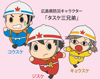
広島県防災キャラクター 「タスケ三兄弟」