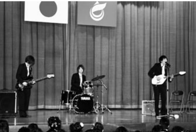
「二十歳のメッセージ」ではアマチュアバンドのステージも