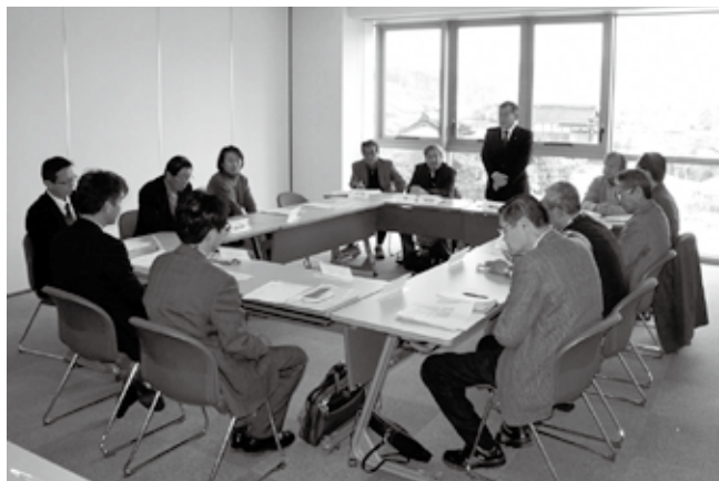
審議会で野生生物保護条例案の検討作業が進められた