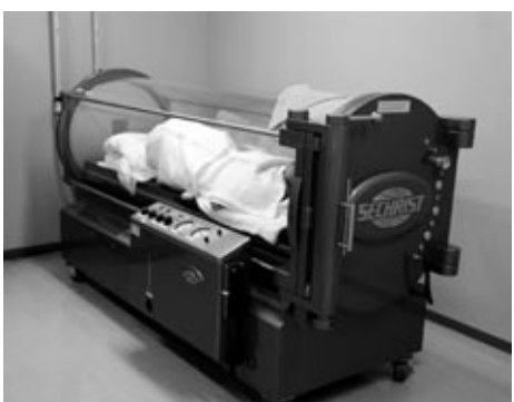
院内の一角に設けられた高気圧酸素治療の部屋。患者は装置の中で横になり、ゆったりとした状態で治療を受けられます。

国民健康保険団体連合会が発行する「広島県の国保No.675」で、北広島町豊平病院が紹介されました。地域医療の現状や課題を考えてみましょう。