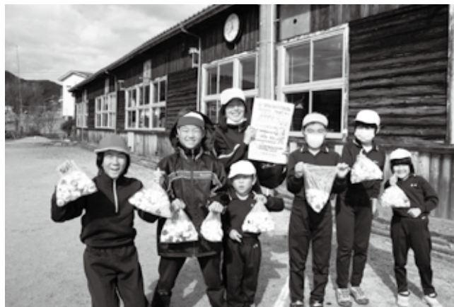
大量のペットボトルキャップを提供した大塚小学校の児童たち