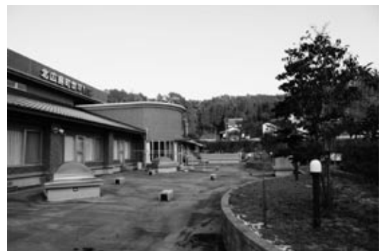
病院の2階にある屋上庭園。病室や談話室からも眺める事ができ、病室からも直接外に出られるようになっています。