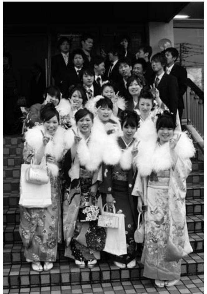
二十歳の記念に友達と記念写真。みんなとびぎりの笑顔を見せてくれた

数年ぶりに同級生と再会した新成人も多く、写真を写しあうなど、閉会后もしばらくの間、その笑顔が途絶えることはありませんでした。