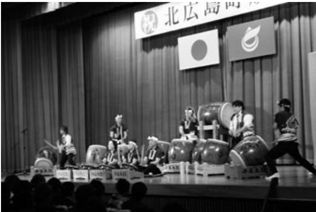
川戸千石太鼓のアトラクションでは、メンバーである新成人2人も巧みなばちさばきを見せた