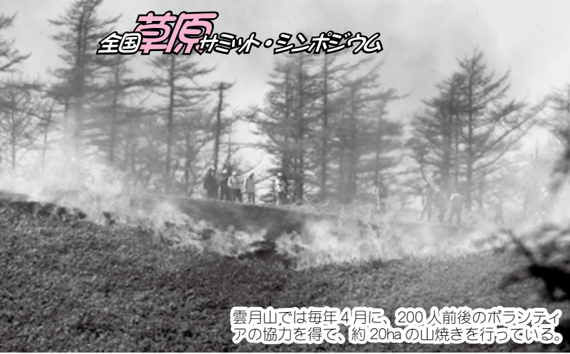
雲月山では毎年4月に、200人前後のボランティアの協力を得て、約20haの山焼きを行っている。