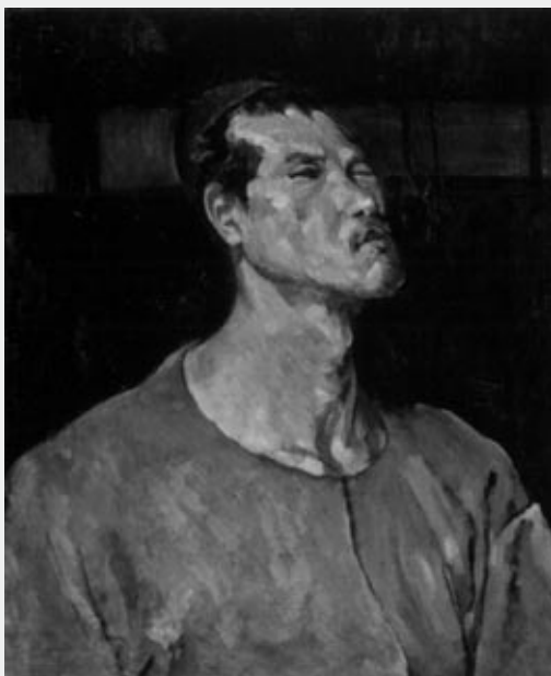
「帽子をかむる自画像」1943年 広島県立美術館所蔵

当時の社会情勢は、戦争に向かつて突き進んでおり、自由平等な思想は弾圧されました。美術界においても、前衛的な絵は取締りの対象となり、鬚光の仲間の中には、治安維持法違反で拘束される者も出ました。そのような中、描きたい絵が描けないことで、鬚光は苦悩します。1943年(昭和18年)、鬚光は新人画会に3点の自画像を出品しますが、翌1944年(昭和19年)に応召。大陸を転戦するうち罹病し、ひどい飢餓をともなつて世を去りました。