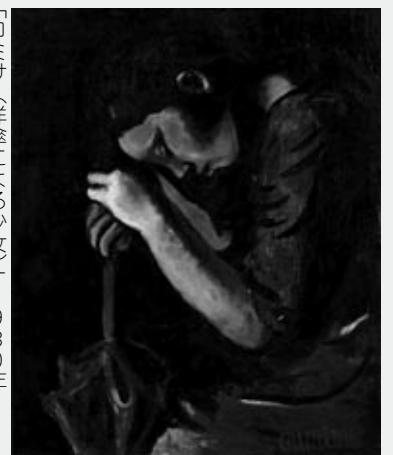
「コミサ（洋傘による少女）」1930年 広島県立美術館所蔵

1907年（明治40年）～1946年（昭和21年）山県郡壬生町（現北広島町壬生）梅ノ木に生まれる。代表作「眼のある風景」は、日本シュルレアリスム（超現実主義）の記念碑的作品。最晩年に描いた自画像3点は、近代日本絵画のすぐれた位置を占め、日本の誇りと言われている。