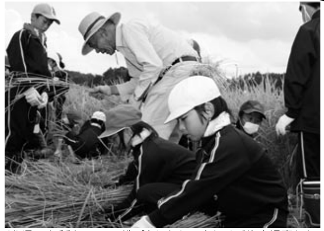
刈り取った稲を、8～10株ごとにわらで束ねる壬生小児童たち。

「田んぼの生きもの調査in北広島町」が、7月31日に川西地区で行われ、壬生小学校児童など20人余りが参加しました。農地周辺の保護につなげるため、中国四国農政局中国土地改良調査管理事務所が主催。児童たちは、田んぼや水路で網などを使い、魚やカエル、カニ、ゲンゴロウなどを捕まえました。生物の名前を調べる同定作業も行った結果、多種多様な水生生物が確認され、環境保全の大切さを学びました。