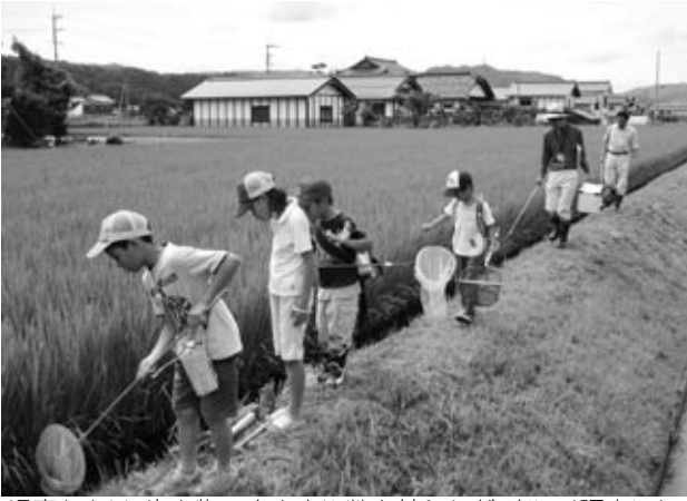
児童たちは、生き物の大きさや数を競うなど、楽しく調査した。