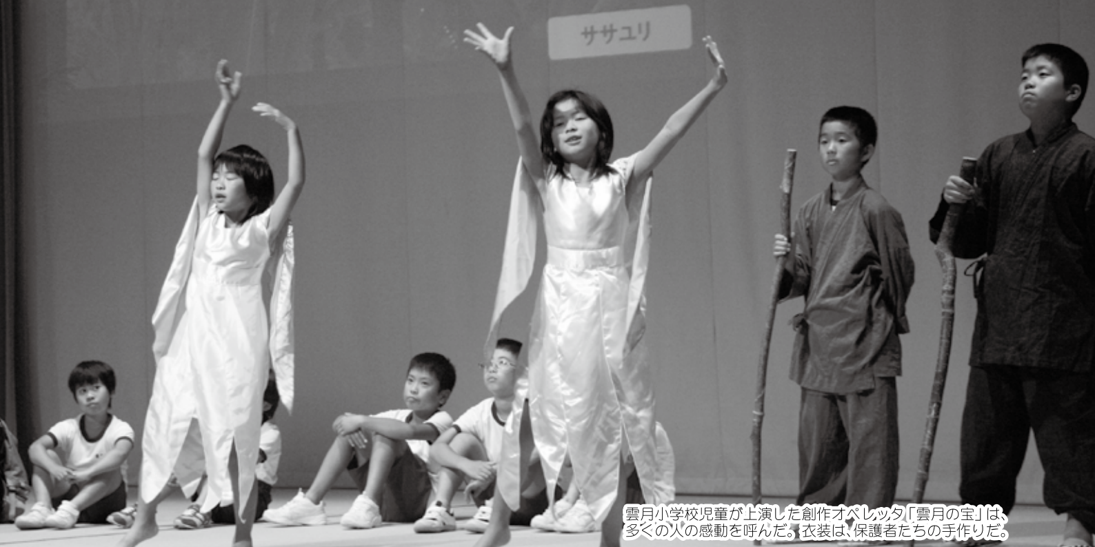
雲月小学校児童が上演した創作オペレッタ「雲月の宝」は、多くの人の感動を呼んだ。衣装は、保護者たちの手作りだ。