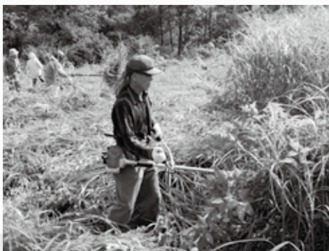
草原景観保全に向け、草刈りなどのボランティア育成も今後の各市町村の課題だ。千町原で8月2日に行われた草刈りでは、子どもを含む40人余りが汗を流した。

いのだが、決めた日にやらず延ばすと、人数がそろわなくなり、同日に火入れする隣町との連携にも影響する。火入れをしやすい方向で、条例の見直しも検討すべきだろう」と話していた。 最後に、「草原の魅力を高め、地域の担い手を育成する」などの指針を含めた「北広島宣言」を採択。市町間連携を誓い合い、今後の草原再生と保全について、心を一つにした。