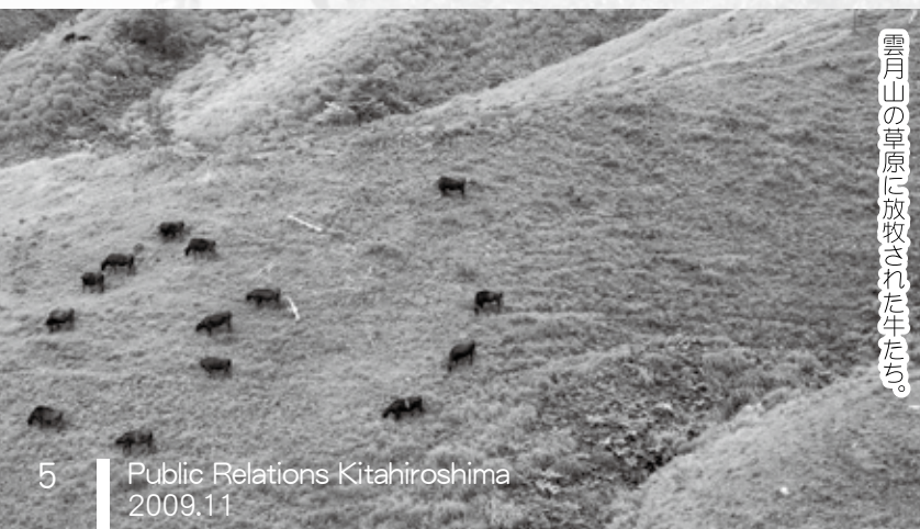
雲月山の草原に放牧された牛たち。

全国こども草原サミットで、雲月小学校児童 17人が演じた創作オペレッタ「雲月の宝」は、山焼きが復活した雲月山が舞台。10年以上前から同校で取り組まれてきたオペレッタの内容を、地域を素材としたオリジナルの構成に変え、平成18年度に現在の「雲月の宝」が生まれた。劇中の随所で歌われる歌には、児童全員に独唱する場面が与えられている。上演は、学習発表会だけでなく、校外へ出て行政主催の催しなどでステージを踏むこともあり、多くの人に感動を与えている。