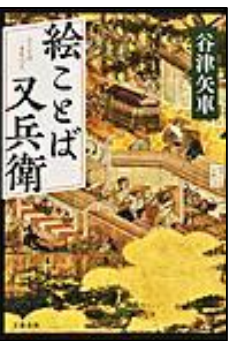
『絵ことば又兵衛』 文藝春秋 谷津 矢車/著