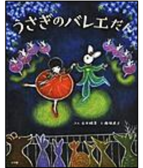
『うさぎのパレエだん』 小学館 石井 睦美/ぶん 南塚 直子/え