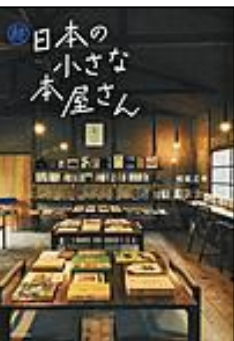
『日本の小さな本屋さん 続』 エクスナレッジ 和氣 正幸/著