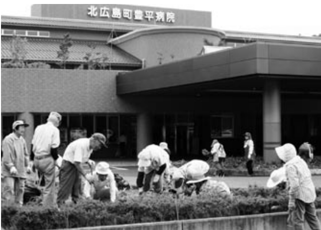
豊平病院での奉仕作業は、昨年に続き2回目となります 阿坂老人クラブ奉仕作業 豊平病院草取りで社会貢献