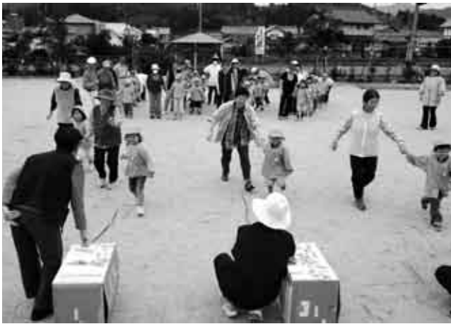
大朝保育所では、園児と地域住民との合同競技が行われた