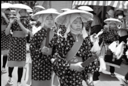
壬生小学校子ども田楽団による道行き。毎年5年生児童全員が参加し、この日を最後に「卒業」。以後は4年生が引き継いで練習を始め、来年の花田植を目指す。