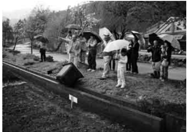
開園式の後、わが家の農園の区画を確認する都市住民たち

経済産業省などが実施した「新エネ百選」に、自然エネルギーを活用中の北広島町が選ばれ、6月1日に選定書を受けました。評価対象となったのは2事業。その一つ、平成13年完成の役場庁舎太陽光発電システムは、外壁と屋上にパネルを設置し、庁舎使用電力量の約20%を供給しています。もう一つは、地形など自然環境を生かし、15年に完成した川小田小水力発電所で、芸北オークガーデンなどに電力を送っています。