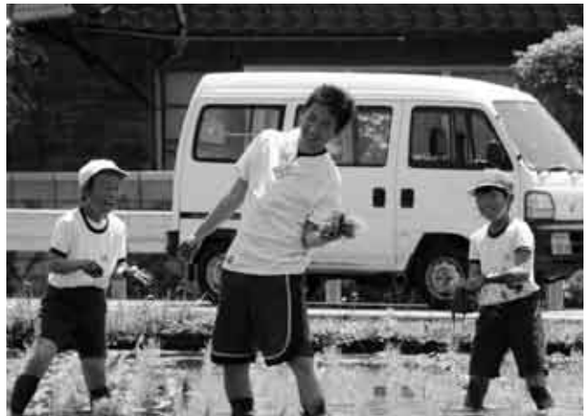
「菜の花ECO（エコ）プロジェクト」の一端に触れるための田植え