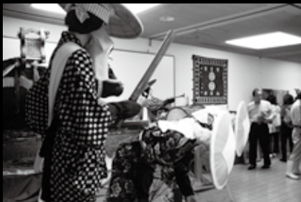
休館中だった芸北民俗芸能保存伝承館（有田）が、5月26日に改装オープン。田楽の大鼓やささら、飾り牛のくらなどのほか、草木染めや神楽衣装なども展示されている。