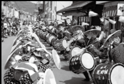
壬生商店街では、田楽団が花田植を演じながら練り歩く「道行き」が行われる。団員たちは、額に汗を浮かばせながら、カメラのフラッシュや拍手を浴びる。