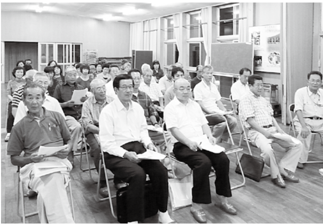
防災担当者の話に熱心に耳をかたむける参加者たち