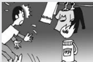
ストーブやコタツで洗濯物を乾かすのは止めましょう。