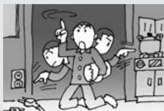
寝る前、外出する前には必ず火の元を確認しましょう。