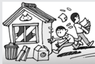
家の周りはスッキリさせる。いつも整理整頓を！