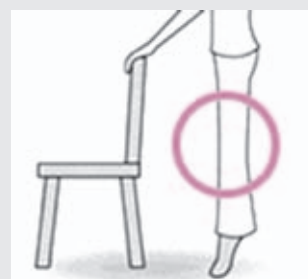
つま先立ち・つま先歩き

ふくらはぎの筋肉を鍛え、地面を蹴る力がつき、歩幅も広がります。また、内臓の働きをよくし、便秘予防にも効果が期待できます！