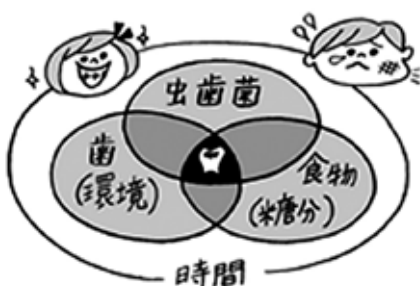
むし歯の4つの条件