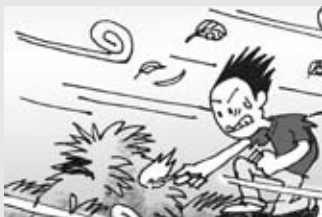
風が強い日のたき火は絶対に止めましょう。