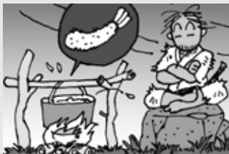
天ぷらを揚げる時は、その場を絶対に離れてはいけません。