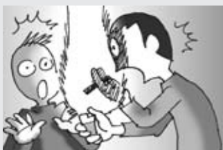
火を扱う時は細心の注意をしましょう。これが大切です。

尚、出火原因は電気配線の絶縁劣化による発熱であった。(平成24年7月・広島市安佐南区)