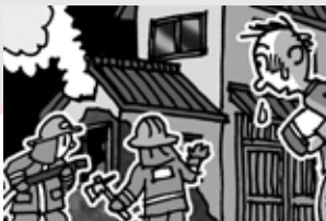
住宅用火災警報器で助かりました!!

2階で就寝中、住宅用火災警報器の警報音で目覚め、廊下に出ると白煙が充満していた。1階への避難が出来ず、ベランダから助けを求めたところ、近隣住民の助けで隣接家屋の屋根づたいに無事避難できた。