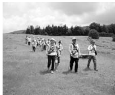
これからは草花や自然を意識しながらのウォーキングができそうです!

7月の「月一ウォーキング」教室は八幡の自然をいっぱい感じながらのウォーキングとなりました。