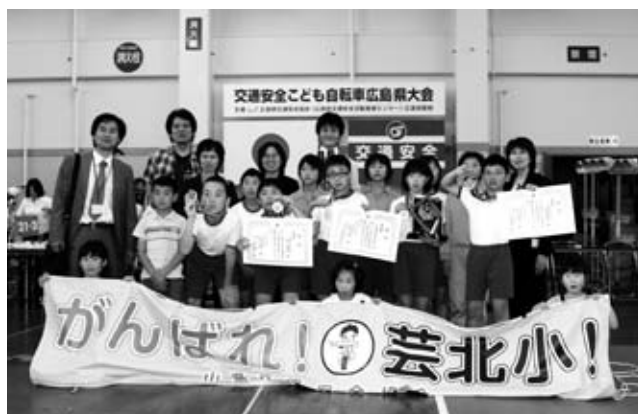
芸北小学校選手と応援のみなさん