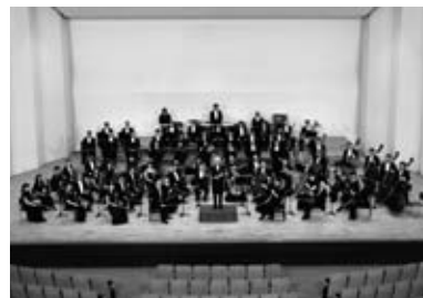
広島交響楽団のみなさん

申込方法 往復はがきに、参加者全員(1枚に4人まで)の住所、氏名、年齢、電話番号を記入し、9月18日(火)【消印有効】までに郵送してください。ホームページからも申込みできます。