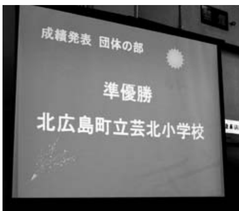
おめでとうございます!! 県大会・成績発表

芸北小学校ではこれからも、子どもたちの可能性を發揮できるこの取組を続けていきたいと思っています。今後も健闘を祈ります。