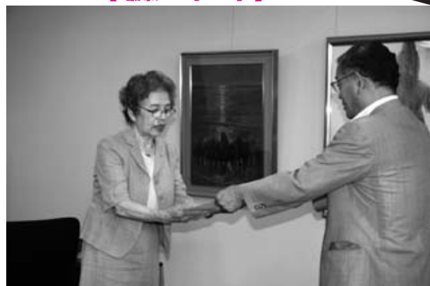
竹下町長から感謝状が手渡されました

7月11日、溝口地区自主防災会の皆さんが今年の防災研修として防災マップづくりに取り組みました。大きな地図に土砂災害危険箇所や日頃不安に思っている場所を描き込み、避難方向を考えたり身近な避難場所を探しました。この日は大雨注意報が発表されており、テレビのデータ放送(dボタン)を使って6時間先の雨雲の動きや雨の強さが分かることも学びました。