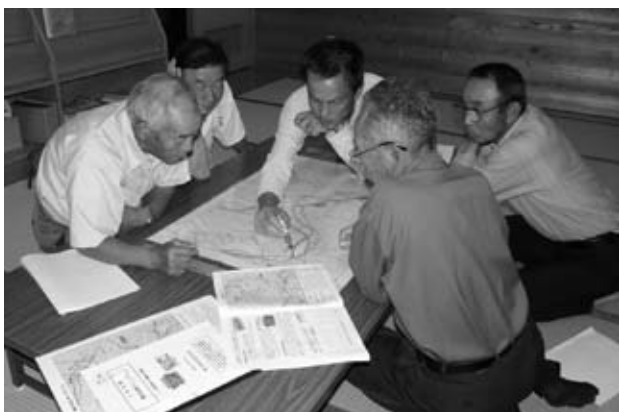
地図に危険箇所などを描き込む会員の皆さん