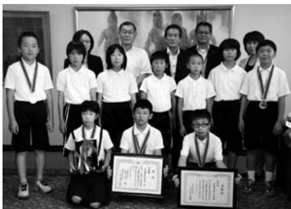
準優勝した芸北小学校5・6年生のみなさん

芸北小学校は、6月24日(日)に行われた交通安全子ども自転車広島県大会において、参加24校の中で準優勝を果たしました。その報告を、7月17日(火)町長室で行いました。報告会の中では、「最後まであきらめないこと」「挑戦する大切さ」「サポートする難しさ」など、今回の自転車への取組から学んだことを児童一人一人が発表しました。