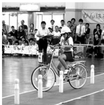
県大会で競技する選手

児童は、6月の大会本番に向けて、5月から2ヶ月間、早朝練習・放課後練習を毎日がんばり、土曜日の午前中も自主練習をしてきました。途中で選手の選考があり、半数は涙をのんでサポート役になりました。そのような過程の中、それぞれの役割を自覚し、選手は選手として、あるいは選手を支えるサポーターとして、総勢11人で当日まで練習を続けました。その結果が今回の準優勝です。その間、山県交通安全協会や山県警察署の皆さん、保護者・教職員・地域の