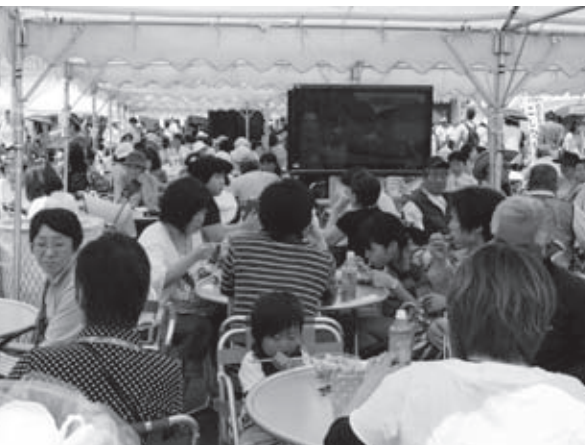
休憩所でほっと一息