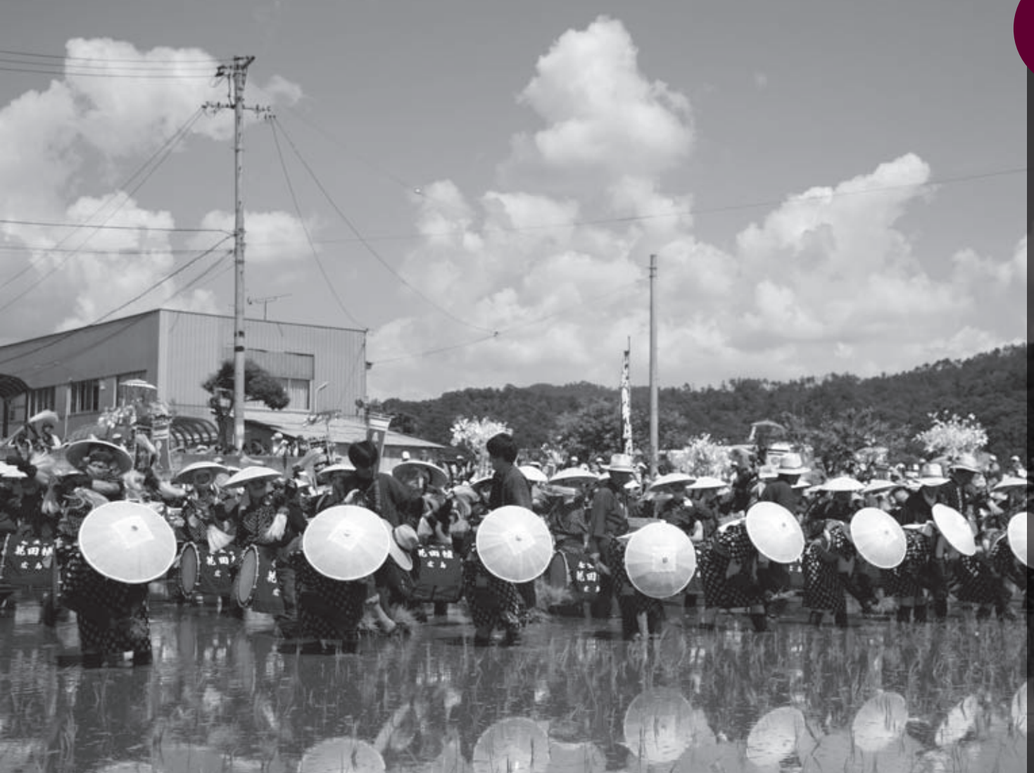
初夏の爽やかな風の中で行われました