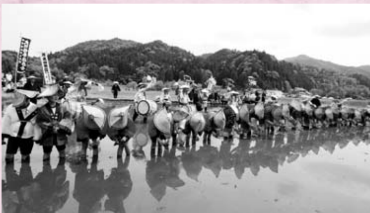
初めて参加した小学生も楽しんでいます