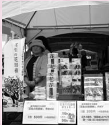
地域産品等販売コーナーの一角