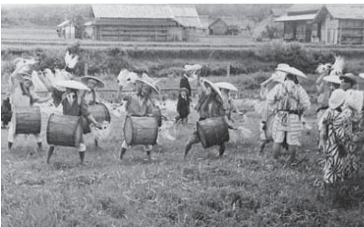
昭和30～40年代の囃し方