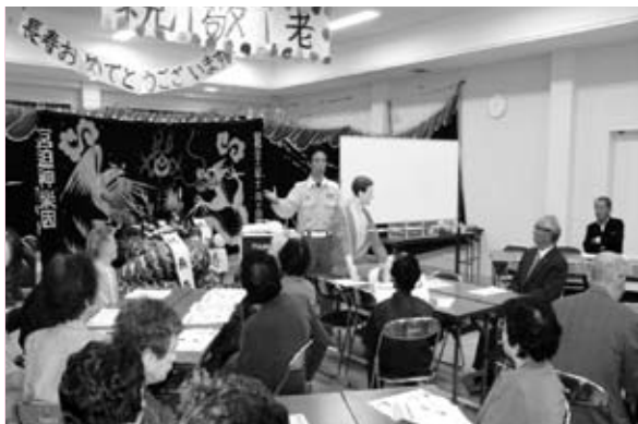
敬老会行事に合わせ応急手当について学ぶ自主防災からしる会の皆さん

地域では、これまで自主防災会に限らず様々な組織や団体、行政区単位で、防火や防災、救急講習会などが開かれてきました。こうして地域の安心や安全を守る取り組みが行われてきましたが、大切なのは、これら様々な組織や団体がいざというときに同じ目的をもって、それぞれの力を発揮する地域協働です。その意味から、自主防災会を結成し、その名のもとに活動することで意識も高まり、地域の防災力はさらに強まります。