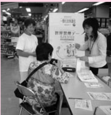
一酸化炭素濃度を測定している様子

パネルの展示、呼気中の一酸化炭素濃度の測定、立ち寄られた方から禁煙の体験談やたばこについての思いなどを聞きました。