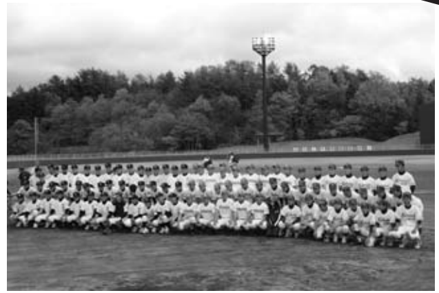
高田高校・国際学院高校・国泰寺高校の皆さん

町内で開催された大花田植などにも参加し、観光PRを行い北広島の魅力を発信しています。