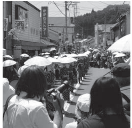
商店街もたくさんの人で賑わいました

地域の宝を伝承しようと壬生小子ども田楽団は、結成され、活動は継続されています。その子ども達が成長し、現在、後継者として、田楽団を支えています。花田植会場でも、子ども田楽団出身者の団員が紹介されていました。 道行きで披露された子ども田楽団の演技は立派で、日頃の練習の成果が伺えました。子ども達は、これからも壬生の花田植を世界の宝として、守り、伝統を受け継いでいくことでしょう。