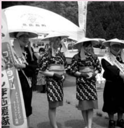
フリータイム・ひろしま、宝しまレディ

今回は、世界無形文化遺産登録を祝って、花田植スタンプラリー・花田植写真コンテストなどの様々な企画があり、お土産品もたくさん準備されました。また、きたひろしま応援隊長・フリータイムも各会場で花田植を盛り上げていました。