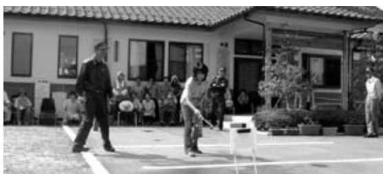
福祉施設との応援協定により消火器訓練をする本地栃田地区の皆さん