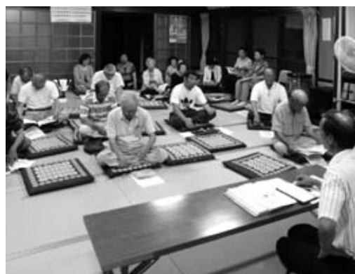
地区の会合の後で地域の災害危険箇所などの勉強会を開いた保余原地区の皆さん