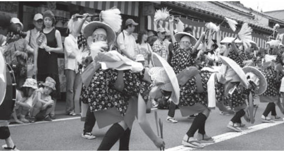
壬生小子ども田楽団による道行きでの披露