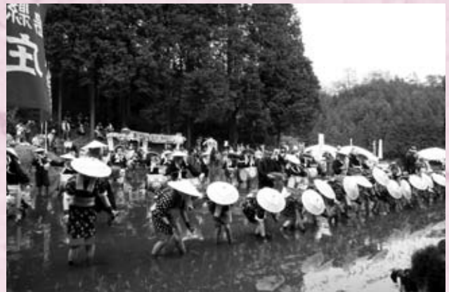
今年も小学生とともにがんばっています