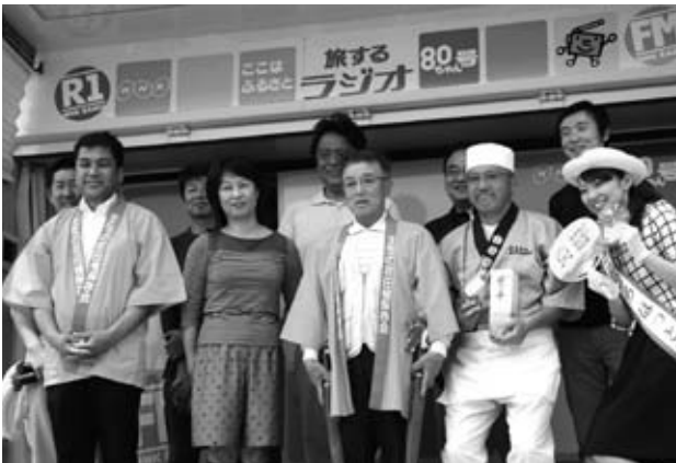
出演された皆さんで記念写真を撮りました