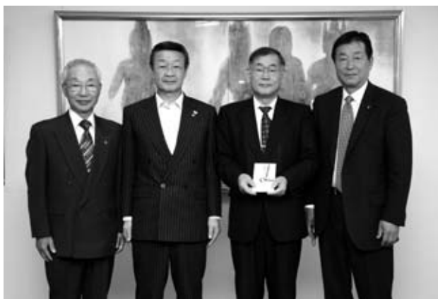
北広島町へ寄贈されました