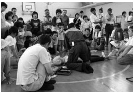
地区の運動会の種目に消防訓練を加えてAED操作を学ぶ筏津自主防災会の皆さん