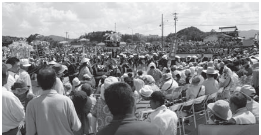
飾り牛と田楽団を見守る観客