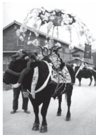
昭和30年代頃の飾り牛

壬生商店街で開催されていた写真展。懐かしくも新鮮な驚きのある写真の数々。長い歴史の中での一コマです。(写真展とは別の写真です)