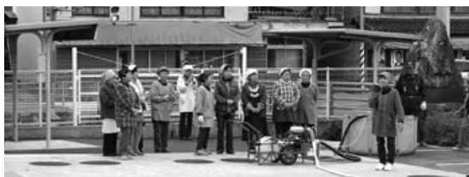
寄贈を受けた消防ポンプの操作訓練をする阿坂女性防火クラブの皆さんの皆さん