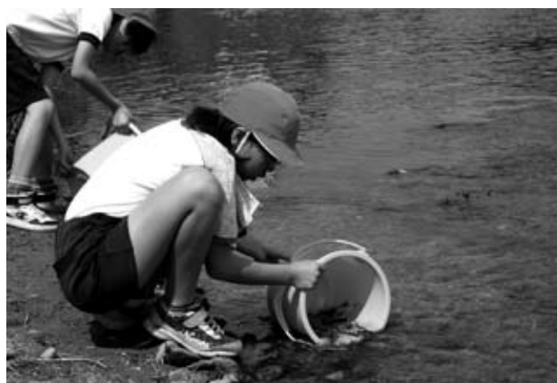
アユの放流を行った本地小学校の4年生

この切手は、5月31日から販売が開始され、2,500部の限定販売となっています。