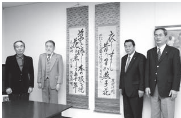
八幡村を詠んだ「衣に擦りし〜」の歌は現在石碑に刻まれて、八幡高原に建てられています

温水プールは、町内で初めての施設、完成後は学校プール・町民の健康増進施設として、幅広い活用を行っていきます。