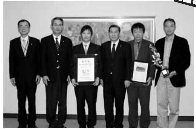
戸谷タートルズのみなさんから優勝報告

11月12日(火)特別養護老人ホーム正寿園内の地域交流スペースで、「あい・あい交流会」が、北広島町社会福祉協議会の主催で行われました。障がいや病気のある方、ない方、子どもから大人まで、誰もが自分らしく地域で生活ができることを目的に、「であい」「ふれあい」、そして喜びを「わかちあい」できる集いとして、年2回行われています。今回もポカポカと心と体が温まる交流会になりました。