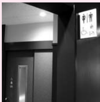
オストメイト対応トイレのマーク