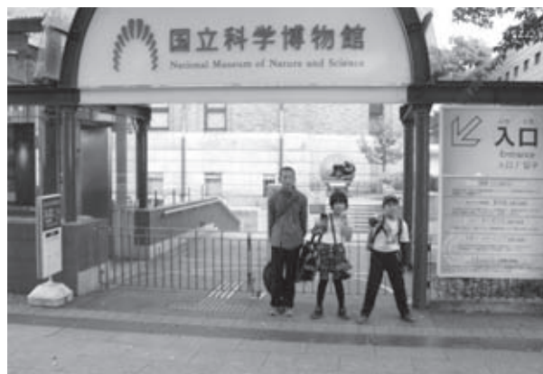
東京国立科学博物館で記念写真！