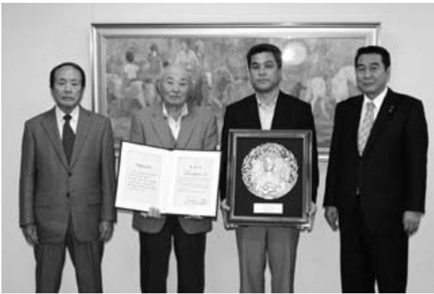
壬生の花田植保存会のみなさんから受賞報告