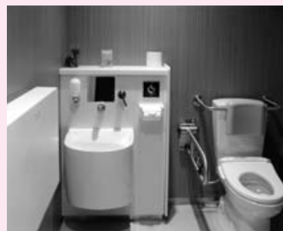
オストメイト対応トイレ