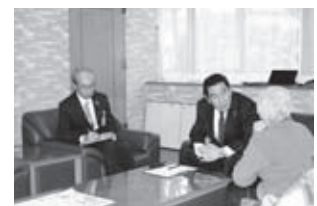
大朝支所での様子