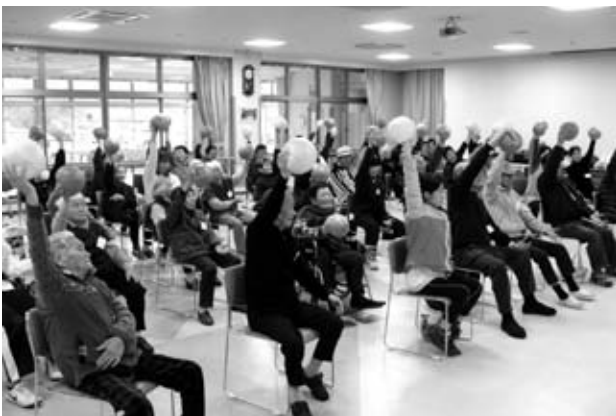
ケアハウス明星の入所者も参加してボールを使った体操などが行われました

ユネスコ無形文化遺産の「壬生の花田植」を伝承している壬生の花田植保存会が、第70回中国文化賞(中国新聞社主催)を受賞されました。中国文化賞は文化・芸術・学術・教育・地域貢献の各分野で活躍した中国地方にゆかりの個人・団体を表彰する賞で、賞牌と副賞50万円を受けられました。11月12日(火)には保存会をさらに強化・充実させるため、壬生の花田植保存会のNPO法人化にむけて設立総会も開催され、二重の喜びとなりました。