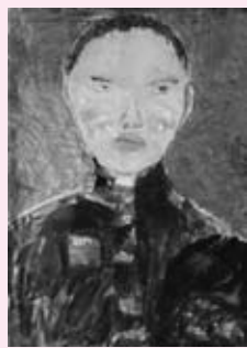
吉村さんの自画像

◎入賞者を招待して、広島県立美術館で鬚光の「帽子をかむる自画像」と「コミサ（洋傘による少女）」を鑑賞しました。