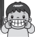
「はつらつ家族表彰」