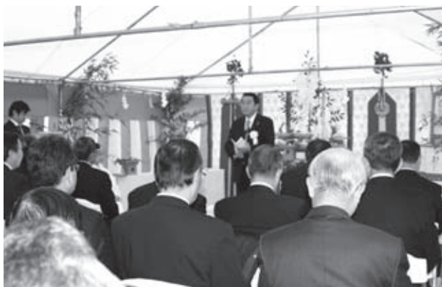
発注者、来賓、設計・施工関係者など40名以上の方が集まり工事の無事を祈願しました