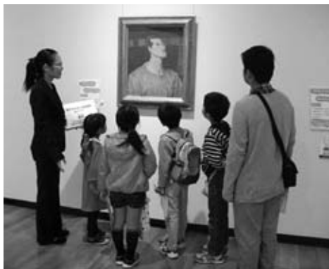
広島県立美術館にて、鬚光の作品を鑑賞しました

◎入賞者を招待して、広島県立美術館で鬚光の「帽子をかむる自画像」と「コミサ（洋傘による少女）」を鑑賞しました。