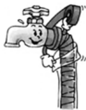
天気予報のチェックを!