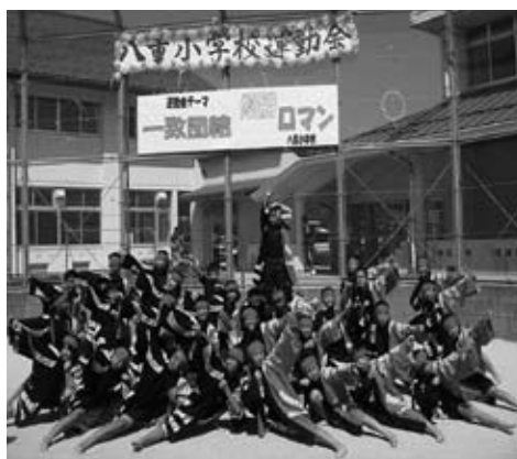
運動会での「八重小ソーラン」

八重小学校では、数年前から、5・6年生が運動会や敬老会で「八重小ソーラン」を発表してきました。昨年、地域の有志の方々が念願の法被を寄贈してくださったことで、こどもたちの踊りにますます勢いが増し磨きもかかりました。発表の機会も増え、回を重ねるごとに、子ども達は自信をつけるごとに、「八重小にソーランあり」と、胸を張って踊れるようになりました。力強くそしてかっこよく踊る姿は下級生にとってあこがれです。