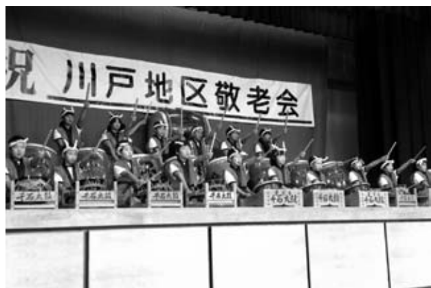
地域の行事にも参加しています

今年度は、これまで、川戸夏祭り、川戸地区敬老会で披露しています。今後は、川迫小学校研究公開、学習発表会で発表していきます。また、11月16日(土)に戸河内のメイプルホールで開催される「ひろしま自慢」に出演予定です。