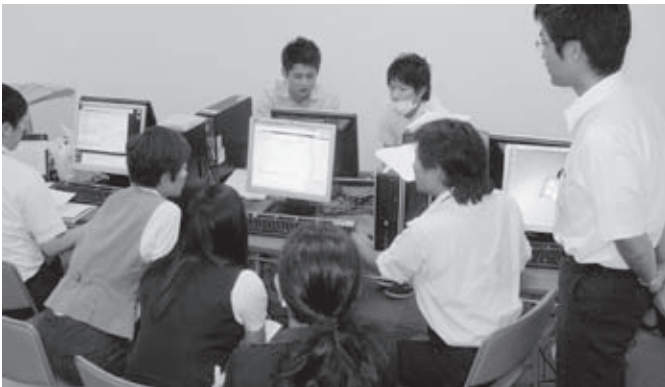
電子カルテ導入に先立ち、業者と打合せを行う病院職員