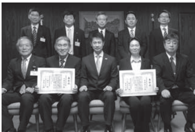
表彰を受けた山縣院長（前列左から2番目）