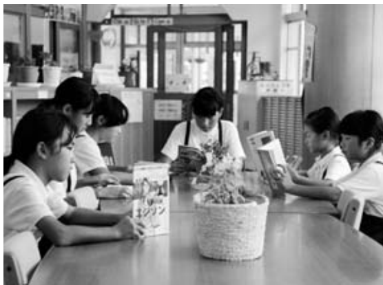
玄関すぐにある図書スペースは読書への入り口

学校をはじめ保護者・地域と一体となり、「本は友だちめざせ100冊 or 10,000ページ」のキャッチフレーズのもと、読書活動推進運動を実施しています。読書が好きになる取り組みとして、保護者、全児童、全教職員が自己読書の記録として、1冊読み終えると記録用紙に記入し、校長室前のグラフにシール(1冊または100ページでシール1個)を貼り、目標に達したら、達成記念写真を撮り校長室前の掲示板に掲示しています。