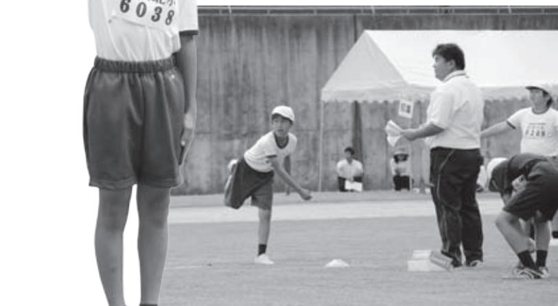
男子ソフトボール投げ

● 小学校陸上記録会北広島会場 北広島町内の小学5・6年生 339名を対象とした記録会が、 千代田運動公園で行われました。 「挑戦・競う・つなぐ」をそれ ぞれのテーマに、「自己最高、能 力・力、応援・交流」を目標とし ていました。暑さは残りましたが 過ぎしやすい秋の一日、参加者み んな全力で競技に取り組んでいま した。