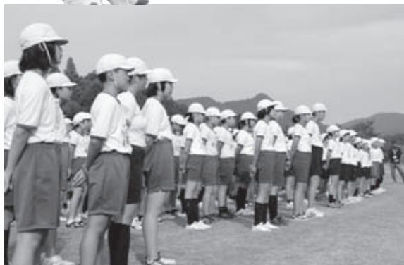
閉会式での児童の様子