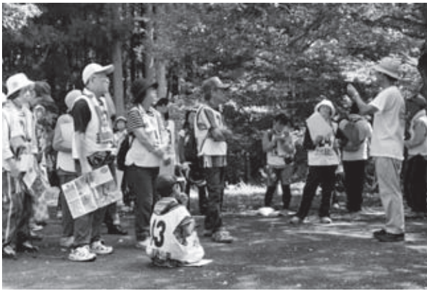
天狗シデについての説明を聞く参加者