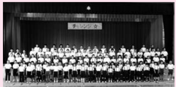
(全校合唱の場面より)