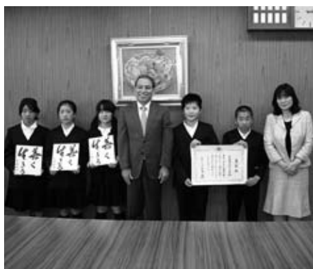
6年生児童が県教育長室を訪問

川迫小学校は、子ども読書の日記念「子どもの読書活動推進フォーラム」(東京)において、平成25年度「子どもの読書活動優秀実践校」として文部科学大臣表彰を受けました。この賞は、文部科学省が平成14年度から子どもの読書活動を推進するため、子どもが積極的に読書活動を行う意欲を高める活動を行っている学校、図書館などを表彰しているものです。今年度は、小学校70校、中学校29校、高等学校34校、特別支援学校4校が全国で選ばれました。