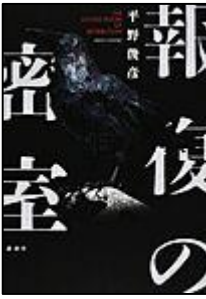
『報復の密室』 THE LOCKED ROOM OF RETRIBUTION 講談社 平野 俊彦/著