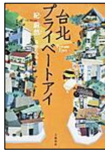
外国の小説 『台北 プライベートアイ』 文藝春秋 紀 蔚然/著 船山 むつみ/訳