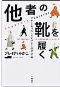
『他者の靴を履く』 アナーキック・インパーのすずめ 文藝春秋 プレイティみかこ/著