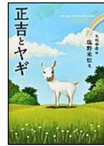
『正吉とヤギ』 福音館書店 しおの よねまつ/ぶん 塩野 米松/文 やぶき 矢吹/え 申彦/絵