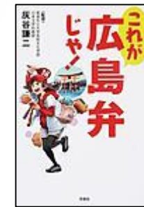
『これが 広島弁 じゃ!』 洋泉社 灰谷 謙二/監修

広島の方で「たちまち」という言葉があります。普段使いをしている広島県民の方も多いことでしょう。“たちまち=とりあえず”の意味を指すこの方言は、関東出身の人間からすると、使う場面が若干異なります。関東圏では、“たちまち=途端に・あつという間に”といった意味合いで使います。「たちまちビール!」も「とりあえずビール!」でしたから、場所が変わることで気づく言葉の違いに、日々驚かされます。