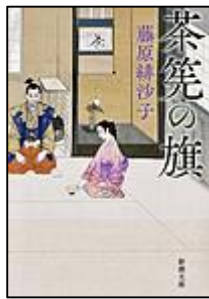
『茶筌の旗』 新潮社 藤原 緋沙子/著