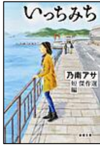
『いちみち』 新潮社 乃南 アサ/著