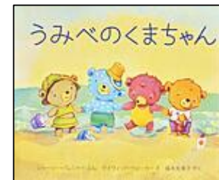
『うみべのくまちゃん』 岩崎書店 シャーリー・パレント-/ぶん デイヴィッド・ウォーカー/え 福本 友美子/やく