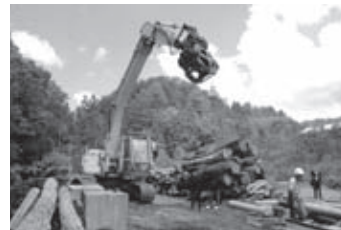
木の受け入れの様子

せどやま市場で、毎週木の受け入れを行っています。木を計量し、少量でも安定した価格（トン6千円）で、地域通貨「せどやま券」に交換を行っています。 登録者のみ利用できます。