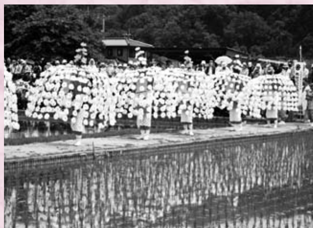
壬生の花田植会場にて本地の花笠踊り（広島県無形民俗文化財） 飾りが和紙で作られているため雨が降ると会場で見ることができません