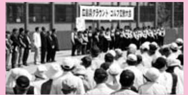
広島県グラウンド・ゴルフ交歓大会 開会式