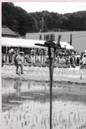
無事に花田植が終わりました (千代田地域)