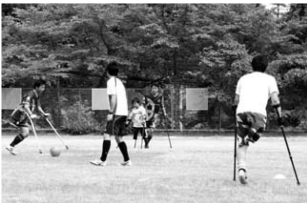
大人と一緒に子どもも頑張っていました

昨年5月に中四国初のチームを立ち上げ、旧豊平西小学校の芝生グラウンドを練習拠点にされている「アフィーレ広島AFC」のメンバーが5月25日、青空のもと練習されていました。この日はTVで「アフィーレ広島AFC」の1年間の活動のドキュメンタリー番組が放送されました。練習するグラウンドでは、地域の方が準備された紫ののぼり旗や横断幕も選手やスタッフを応援していました。6月に大阪で開催される大会に向け皆さん汗を流していました。