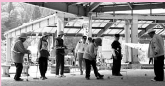
ゲートボール大会 (芸北地域)