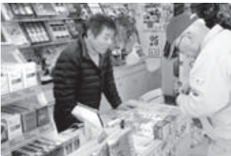
地域の商店でせどやま券を使い買い物をしている利用者