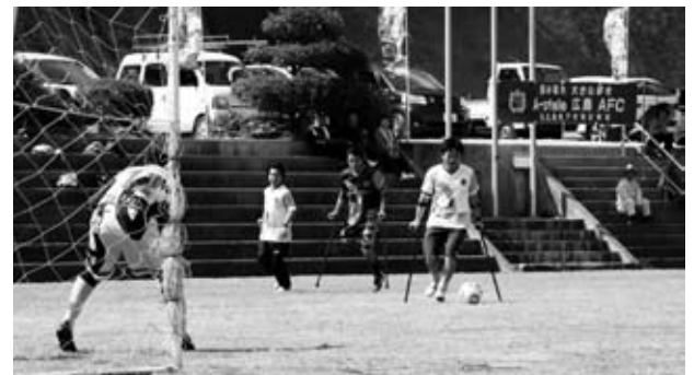
アフィーレ広島 AFC 選手の実習を見守る地域の方々