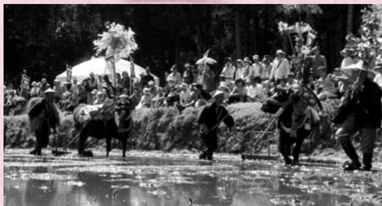
最初に飾り牛が田に入り代掻きをします (大朝地域)

来場者は、自然に囲まれた各会場で、おもてなしの心に接して初夏の一日を過ごしているようでした。