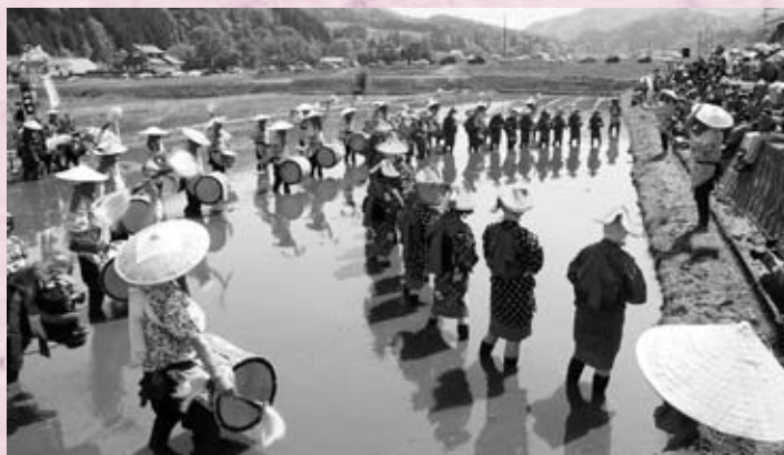
花田植全体の指揮をとるサンバイを見守る田楽団の皆さん (豊平地域)

今年も、夏空のもと、華麗な一大田園絵巻が繰り広げられ、約1万1千人の来場者で、会場は賑わいました。