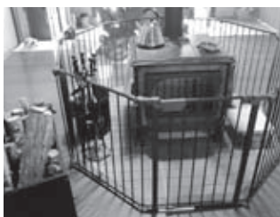
個人宅に設置されている薪ストーブ