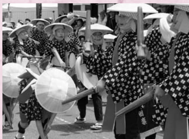
壬生商店街で壬生小子ども田楽団による道行 子ども達は伝統を受け継ぎ、後継者として田楽団を支えています