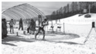
クロスカントリースキー