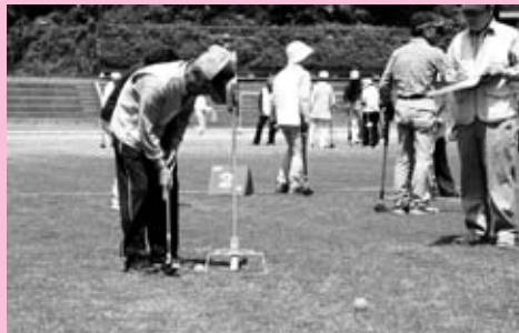
広島県グラウンド・ゴルフ交歓大会 (千代田地域)