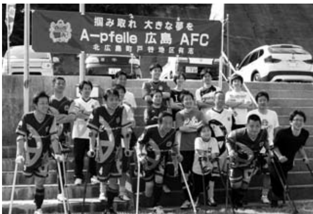
横断幕の前で記念撮影

5月19日、高齢者向けリハビリテーションソフト「音描空」の贈呈式がありました。これは大崎上島町にある国立広島商船高等専門学校の教授と学生が開発された高齢者向けのリハビリテーションゲームソフト一式を販売元である(株)ネクサスと(有)ネクストライから北広島町に寄贈されたものです。当日は箕野町長や加計議長がテレビ画面に映し出される風船を割るゲーム等を行いました。今後は豊平病院で活用します。