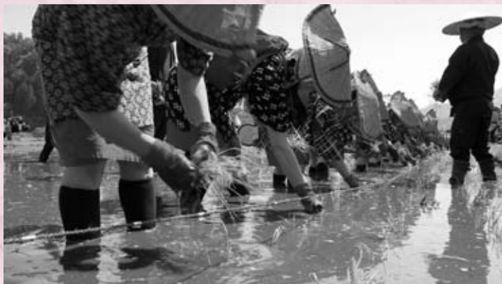
田植歌を歌いながらきれいに苗を植える早乙女たち (豊平地域)

当日は、保育所のおゆうぎ、子ども神楽、芸能発表など幅広い年齢層の方が参加してイベントを盛り上げていました。