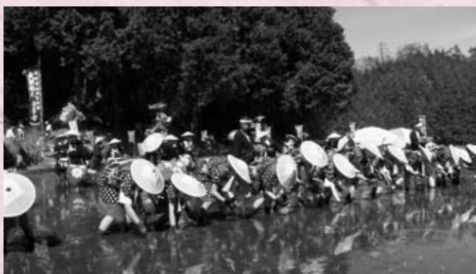
小・中学生から大人まで参加している早乙女とはやし手 (大朝地域)

会場では、県の無形民俗文化財に指定されている「南条踊り」や神楽なども披露されました。