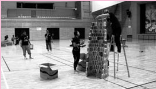
空き缶積み上げ大会 (豊平地域)

毎年5月の最終水曜日に世界中で実施されているスポーツイベントです。人口規模がほぼ同じ自治体同士が、午前0時から午後9時までの間に、15分以上運動をした住民の『参加率%』を競い合います。年齢や性別を問わず誰もが気軽に参加でき、「住民の健康づくり」や「スポーツ振興」「地域の活性化」のきっかけづくりに最適なイベントです。