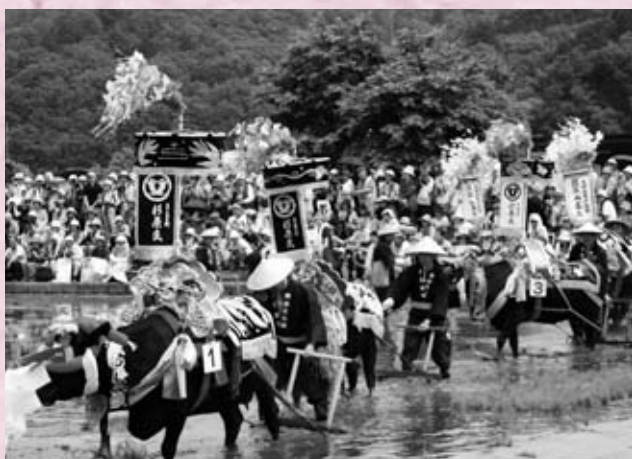
壬生の花田植会場を彩る飾り牛 町内外から 14 頭の飾り牛と追手の皆さん 20 歳代の女性から 80 歳代の男性まで幅広く参加されていました