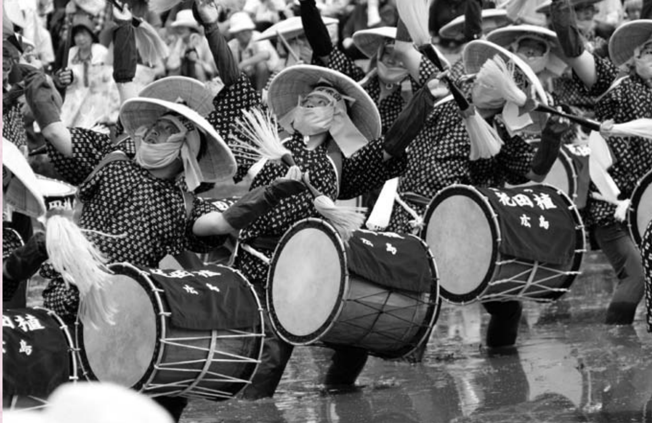
壬生の花田植会場での大太鼓・小太鼓・手打鉦・笛の囃し てうちがね はや サンバイのササラにあわせて大きく軽やかな動きを見せてくれます 宙を舞うバチ、前後左右に体を動かして、にぎやかな囃しは続きました