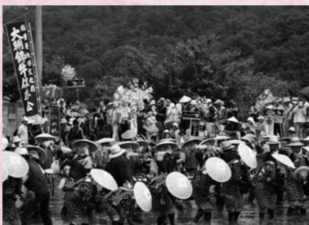
壬生の花田植会場では田楽団の皆さんを観客が見守り、会場周辺では地域のボランティアスタッフ 150 人が壬生の花田植を支えています