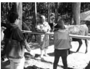
「飾り牛」調査の風景