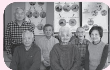
胡子町元気クラブの皆さん (毎週水・金 午後2時～3時30分)

胡子町元気クラブを始めたいきっかけは、「夏の間はゴルフがあるけれど、冬は何も行事がないね」という話が出たことです。