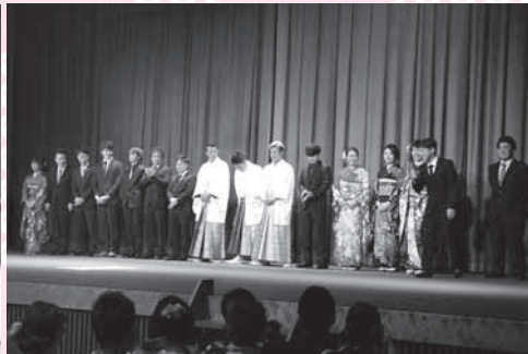
成人式の企画を担当した新成人スタッフの皆さん