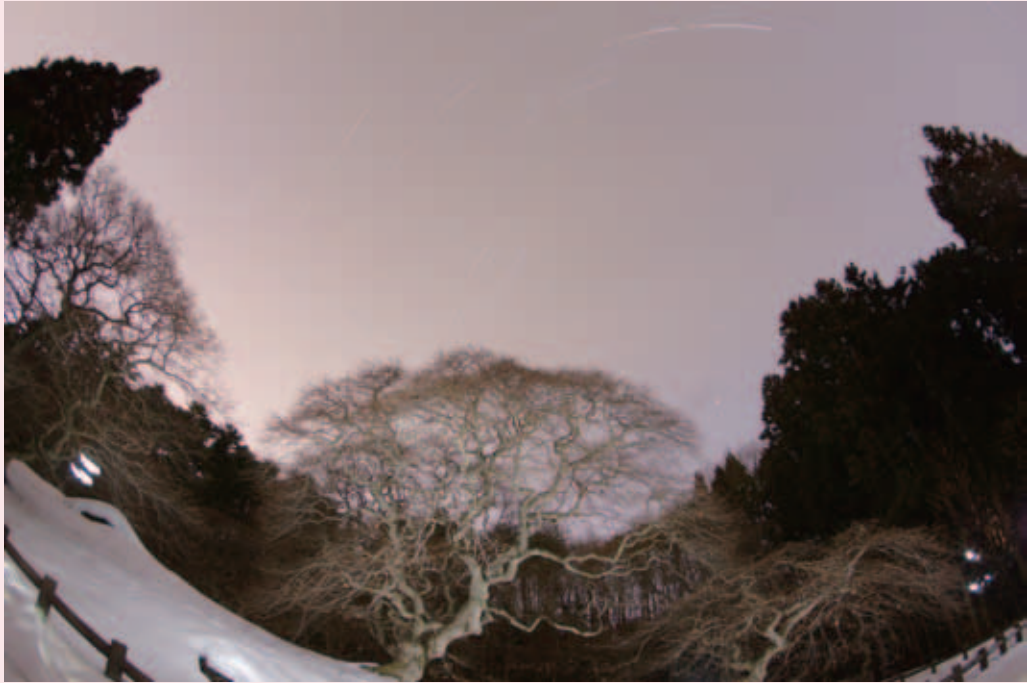
【審査員賞】 厳冬 [撮影場所：大朝地域]

Photograph of Kitahiroshima 北広島町観光写真コンテスト入賞作品