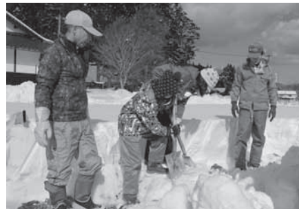
2/1（木） 大崎上島町立木江・ 大崎・東野小学校