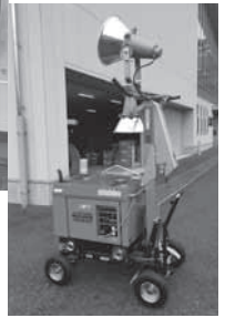
寄贈いただいた投光機