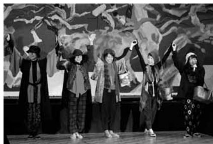
最後は全員壇上に上がりました

で、流れてくる曲に合わせて出演者が1人ずつ登場して自由に歩き、ときには壇上から降りて客席に行き、観客の目の前で大朝張を見せました。