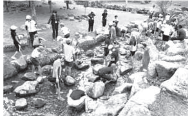
町内民泊体験 大暮養魚場でアマゴの つかみどり