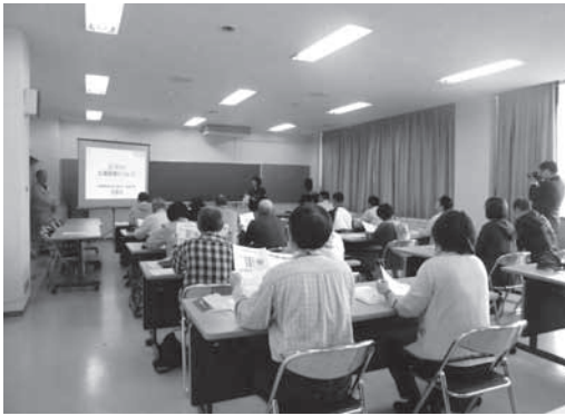
座学（土づくりについて）