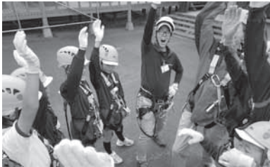
お宝発見・体験ツアー ユートピアサイオトで ジップライン体験