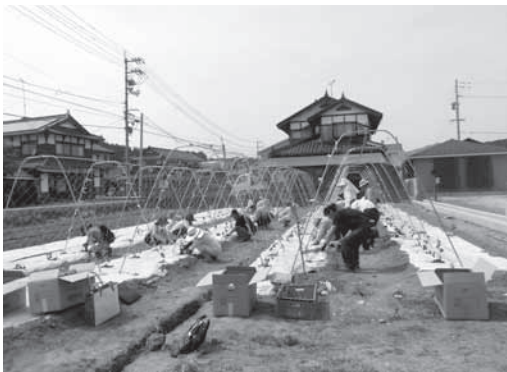
現地研修（きゅうり定植実演）