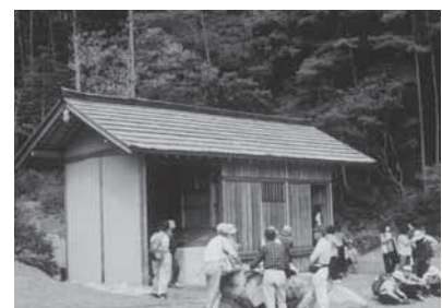
万徳院跡の風呂屋

☎教育委員会 生涯学習課 IP ☎050-5812-1864 戦国の庭 歴史館 IP ☎050-5812-1785