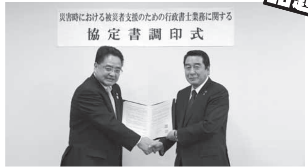
光宗会長と箕野町長