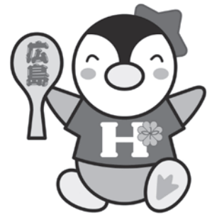
民生委員児童委員 イメージキャラクター 「ミンジー」