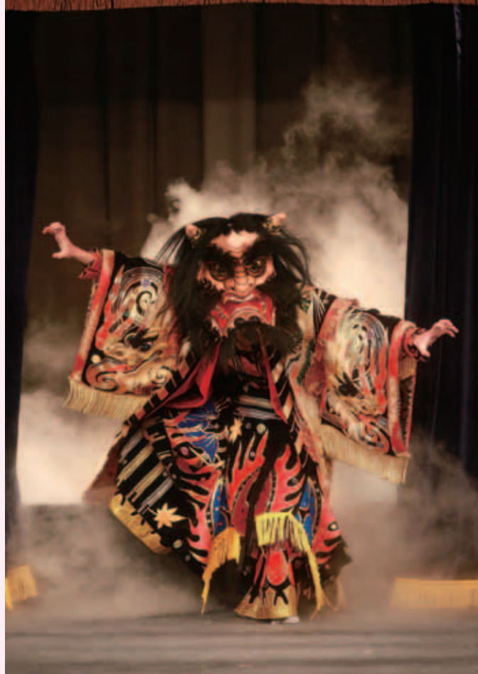
【特選】 上本地神楽団「羅生門」 〔撮影場所 千代田地域〕

(一社) 北広島町観光協会では、3年に一度、神楽写真コンテストを実施しています。今回は、平成29年春に行われたコンテストの特選作品をご紹介します。