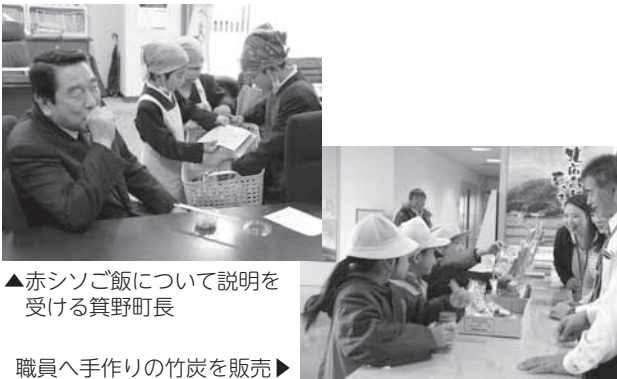
▲赤シソご飯について説明を受ける箕野町長