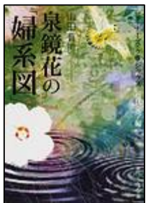
『泉鏡花の「婦系図」ビギナーズ・クラシック近代文学編』 山田 有策著 KADOKAWA/角川ソフィア文庫