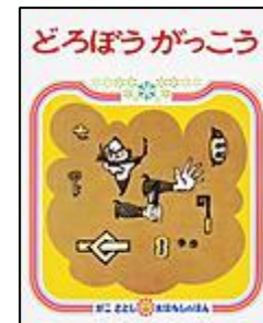
『どろぼうがっこう』 偕成社 かこ さとし作・絵

絵本の『どろぼうがっこう』では、大どろぼうの“くまさかたらえもん先生”と、どろぼうがっこうの生徒たちが盗みをはたらこうと入り込んだ建物が、なんと警察署の牢屋だった!というオチが待っています。他にも流刑に処された男と押送人の情景を描いた『流人道中記』や、『モンテクリスト伯』も所蔵があります。手に汗握る人間模様が味わえる脱走・脱獄本、おすすめです!