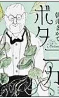
『ボタニカ』 祥伝社 朝井 まかて/著

牧野は北広島町に訪れたことがあり、芸北地域の八幡高原には句碑もあります。他にもカキツバタの汁でハンカチを染めた記録なども残り、縁を感じずにはられません。