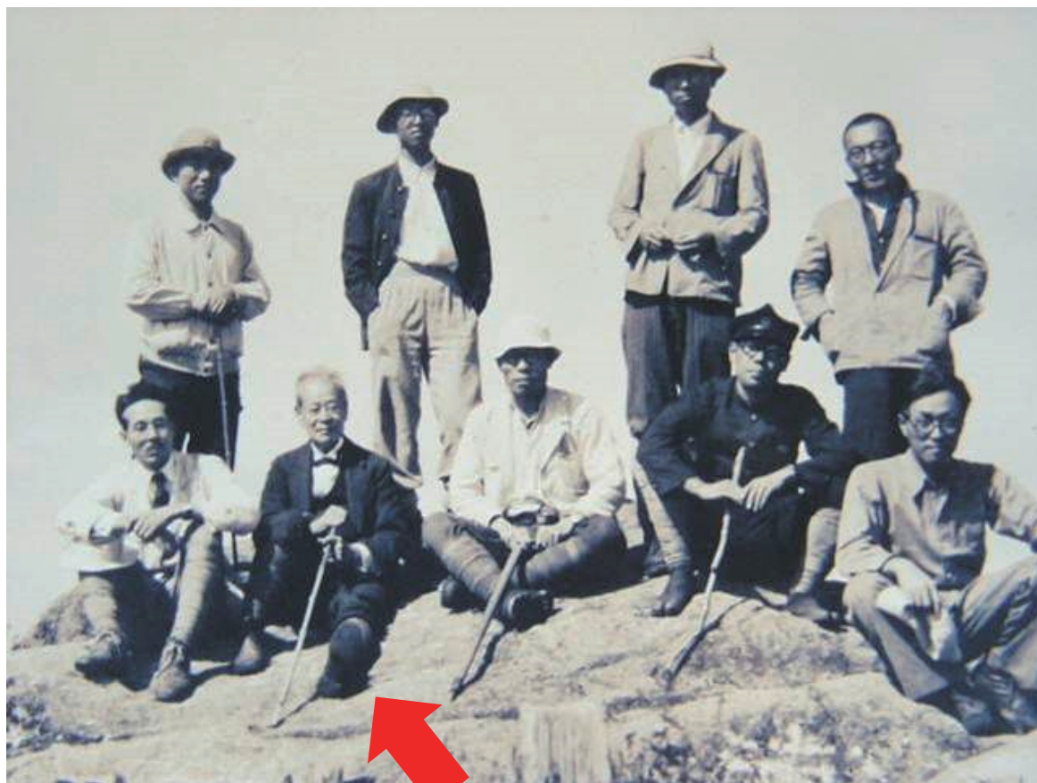
臥竜山 山頂での記念撮影