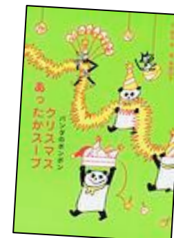
『パンダのポンポンクリスマスあったかスープ』 理論社 野中 柊/作 長崎 訓子/絵

日々の具材選びの選択肢が増えること間違いなし! 子どもたち向けに書かれた本では、街で一番人気のコックであるパンダのポンポンがトナカイのために温かいスープを作るお話『パンダのポンポンクリスマスあったかスープ』(野中 柊 作/長崎 訓子 絵/理論社)や、妻を亡くした孤独なおじいさんが、おばあさんの作ってくれたおだんごスープを自ら作り、少しずつ明るさを取り戻し動物や子どもたちとテーブルを囲む『おだんごスープ』(角野 栄子 文/市川 里美 絵/偕成社)などスープは人々の心を温め、幸せな時間をもたらしてくれる料理として描かれています。