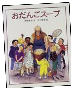
『おだんごスープ』 偕成社 角野 栄子/文 市川 里美/絵

『おいしいねってほめられスープ』(馬場 香織 著/永岡書店)では、基本的なだしの取り方からアレンジレシピまで国籍を問わない調理方法で紹介されています。また、『まんぷくみそ汁』(堤 人美 著/宝島社)は日本ならではのスープである“お味噌汁”のレシピ本。普段の具材とは一線を画すアイデア溢れる組み合わせが数多く収められています。