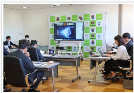
事業者によるオンライン プレゼンテーションの様子

ひろしまサンドボックス事業「The Meet 広島オープンアクセラレーター北広島町最終オンラインプレゼンテーション」を開催しました。全国のスタートアップ企業などから先端技術を活用して地域課題解決に資する協業案を募集するもので、今回は22の提案から3つの提案を採択。今年度中に実証実験に着手します。