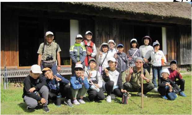
参加者全員での集合写真