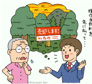
媒介手数料を先に払って...