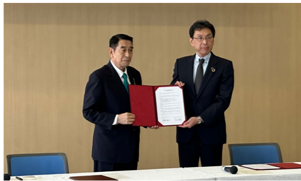
署名した協定書を手にする箕野町長と広島工業大学長坂学長