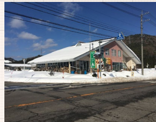
◀ ぞうさんカフェ外観