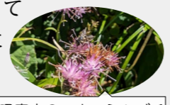
ホクチアザミで吸蜜中のニホンミツバチ

「高断熱・高気密」住宅は、室内の暖気や冷気を保持できるため冷暖房費を節約できます。また、快適な居住空間は、起床時の血圧変化に好影響を及ぼすことが分かっています。アトピーやぜんそくなどへの疾病も住居内環境が影響しているといわれています。エコとともに健康も手に入れましょう。