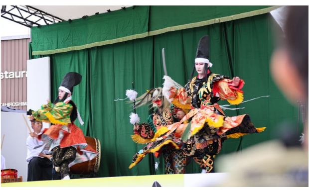
華麗な舞で道の駅を訪れた多くの人を魅了した

Kumahira Park北広島で開催された町内小学校5・6年生対象の陸上記録会の開催に向けて(一財)どんぐり財団からスポーツドリンクの寄贈がありました。この取組は町内の子どもたちのスポーツ環境向上のために約7年前から始められました。開催当日、スポーツ飲料を受け取った子どもたちはそれぞれ全力で競技に取り組み、自らの記録に一喜一憂していました。