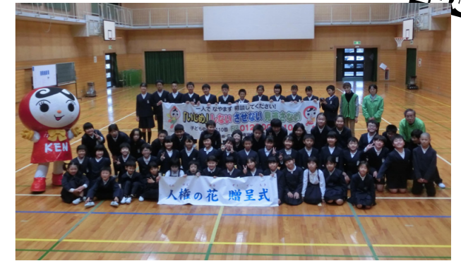
大朝小学校での「人権の花」贈呈式