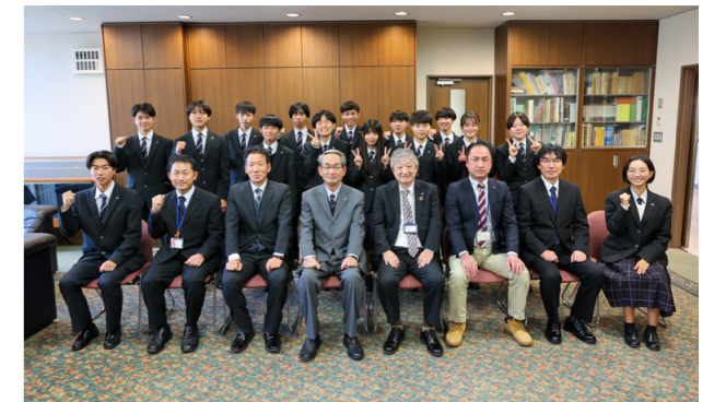
千代田高校のみなさんと町関係者の集合写真

大朝小学校の贈呈式では、人権擁護委員がはじめに関する紙芝居を披露し、児童が人権やいじめを考えるきっかけとなりました。