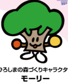
ひろしまの森づくりキャラクター モーリー

森林が持つ公益的機能(洪水や土砂崩れ等を防ぐ機能)は私たちの安心・安全な生活を支えています。しかし、近年人との関わりが減り、放置された森林では公益的機能の低下をはじめ、様々な問題が起こっています。