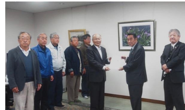
農業委員から箕野町長へ意見書が手渡された

今回は地域の祭りと合同での開催。開催日当日は老若男女問わず多くの参加者で賑わい、普段触れる機会のないスポーツを楽しんでいました。会場では豚汁などが振る舞われ、寒いなかでも笑顔あふれるイベントになりました。