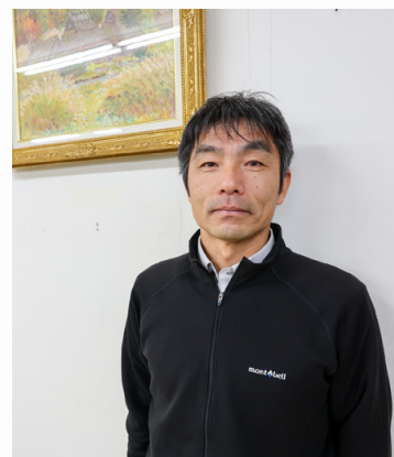
クロスカントリースキー指導者

また、競技者としても長年競技に打ち込み、インターハイにも出場。高校時代から37歳まで国民体育大会に出場した経歴の持ち主でもあります。 そんな藤井さんがスキーを始めしたのは小学生のとき。アルペンスキーから始まり、当時小学校の先