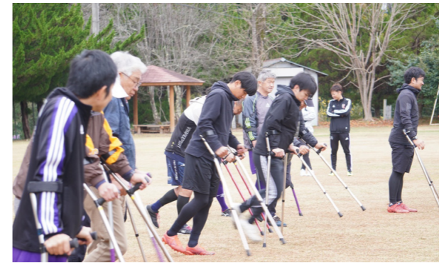
全身の筋肉が目覚ます!? アンプティサッカー