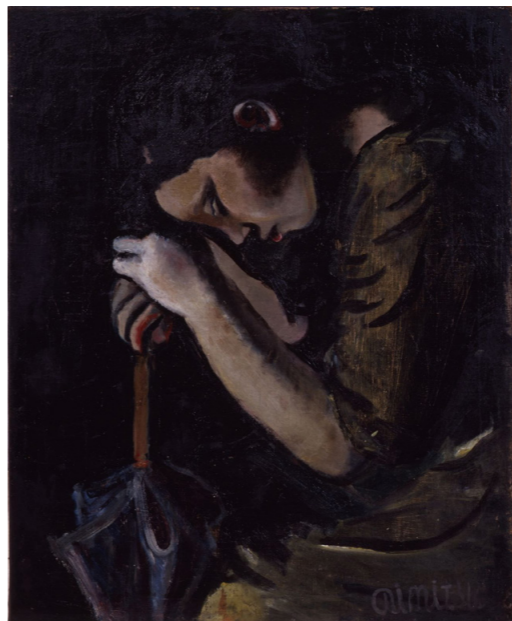
「コミサ（洋傘による少女）」 広島県立美術館所蔵

10月7日(土)、シヨッピングセンターサンクス「ギャラリー・森」で第16回 鬚光記念北広島町児童生徒自画像展の表彰式を開催しました。表彰で大賞を受賞した4人の児童・生徒は、副賞として東京招待旅行（東京国立近代美術館の見学）に行き、他の入賞者15人は広島県立美術館を見学しました。