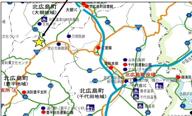
とよひら田園住宅