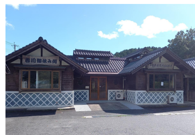
手打ちそば処「吉川庵」 10月18日開店!! (土日営業)