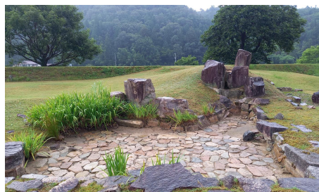
復活した名勝庭園をご覧あれ！