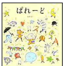
『ぱれーど』 講談社 山村 浩二 さく