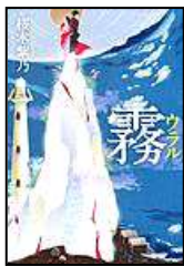
『霧 (ウラ)』 小学館 桜木 紫乃/著