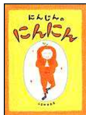
『にんじんの にんにん』 アリス館 ふるや かおる 作