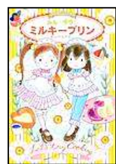
『ミルクプリンの ミルクプリン』 岩崎書店