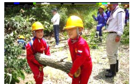
【せどやま再生事業(芸北)】

今年度の具体的な事業計画は、次の通りです。プロジェクト事業を実施するにあたっては、箕野町長を応援隊長とする応援隊が町全体で組織され、企画立案や運営にあたることになっています。