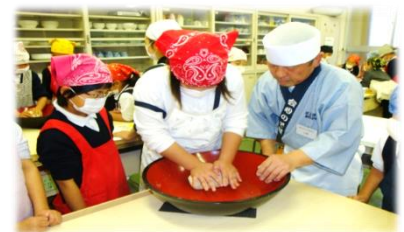
【そば打ち体験学習(豊平)】

「ふるさとキャリア教育事業」については、地域と一体となった地域の振興・新たな活力づくりに貢献できる事業（地域の方といっしょに企画・運営）を展開することをめざして、各学校で今年度中に計画を立てたり、組織作りを行ったりすることになっていきます。本格的な実施は、来年度になる予定です。