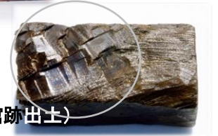
下: 手斧の痕 (吉川元春館跡出土)