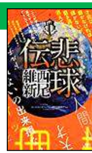
『悲球伝』 西尾 維新/著 講談社