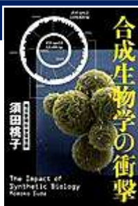
『合成生物学の 衝撃』 文藝春秋 須田 桃子/著