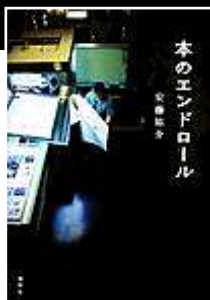
『本の エンドロール』 講談社 安藤 祐介/著