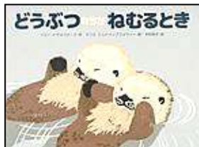
『どうぶつたちが ねむるとき』 偕成社 伊藤 有子/作 マリエ・ツトウソフ フォー アー/絵 木村 有子/訳