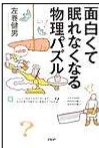
『面白くて 眠れなくなる 物理パズル』 PHP 左巻 健男/著