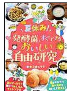
『夏休み！発酵菌で おいしい自由研究』 あかね書房 小倉 ヒラク/文・絵