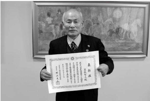
受賞された箕牧さん

1月30日（水）、芸北文化ホールで、加計高校芸北分校の生徒によるプレゼンテーション発表会が開催されました。政治経済の授業を選択している3年生が5グループに分かれ、芸北地域の課題解決プランを考案。特産のりんごや自然を活かした観光プラン、高齢者が住みやすい地域づくり、夏のスキー場活用、空き家を改修した就農希望者向けのシェアハウスなど、自分たちにできることも交えて発表しました。