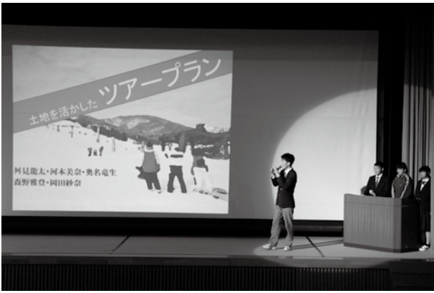
観光プランを発表する生徒たち