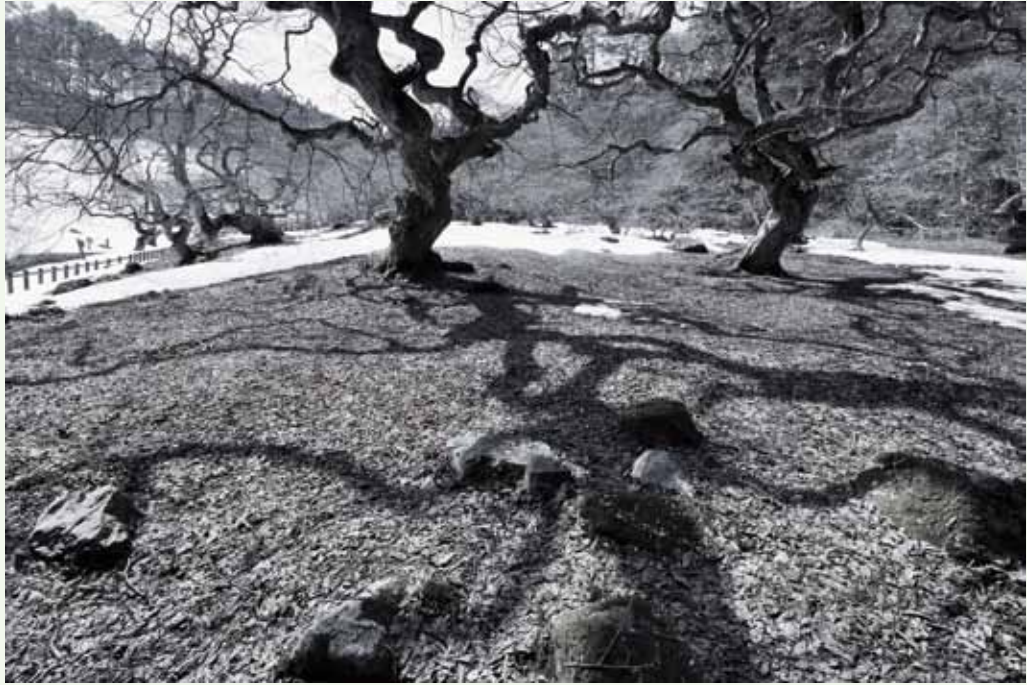
【テングシデ賞】 パワースポット [撮影場所：大朝地域]

Photograph of Kitahiroshima 北広島町観光写真コンテスト入賞作品