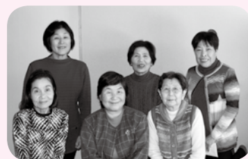
南方元気クラブの皆さん (毎週火・木 午後1時30分~3時)

家では三日坊主で終わってしまふ体操も、元気クラブに来ると続けられます。今では、音楽を聞くと体が勝手に動くようになりました。体操を何日か休むと、体が硬くなり思うように動きません。やはり、週に2回の体操をできるだけ欠かさず続けていくことが大切です。 また、元気クラブに来てみんなと話をするので、体だけでなく口の体操にもなっています。南方元気クラブでは、年に1回親睦会を行い、一緒に食事をします。この体操を通じて出会えた縁を大切に、これからも続けていきたいです。