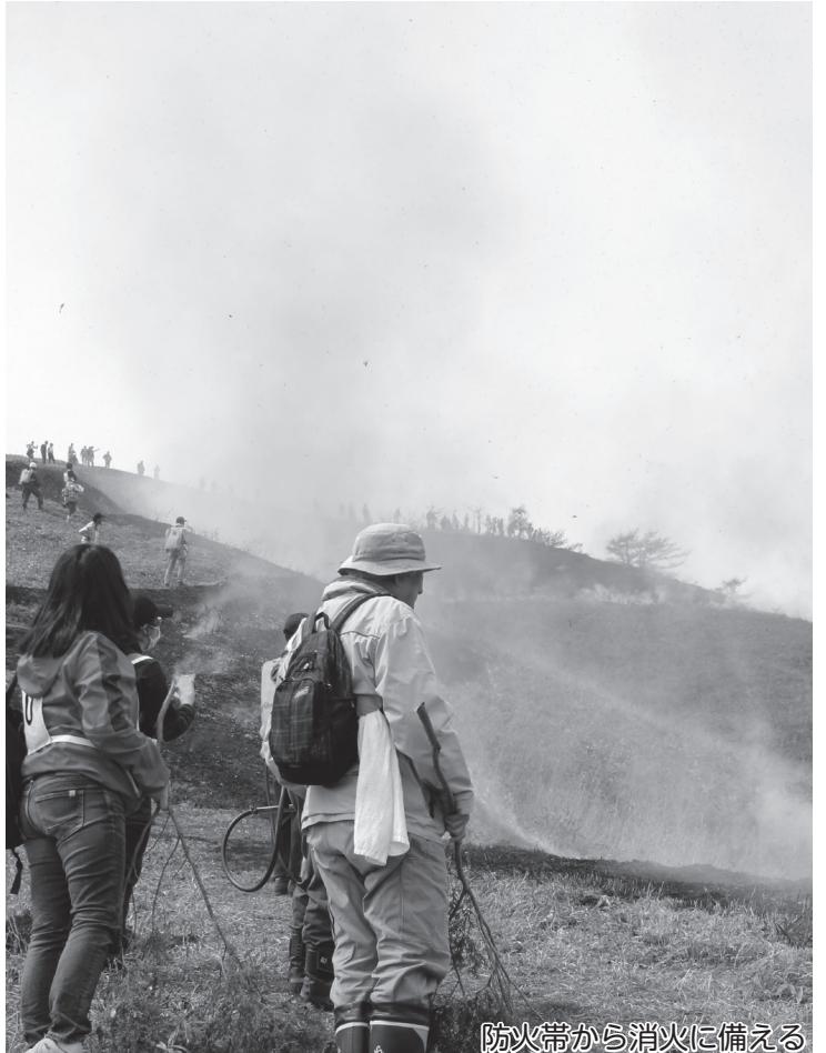
防火帯から消火に備える

4月13日(土)、島根県との県境に位置する雲月山 うんげつさん (北広島町土橋)で、3年ぶりとなる山焼きが行われました。