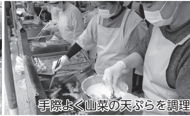
手際よく山菜の天ぷらを調理