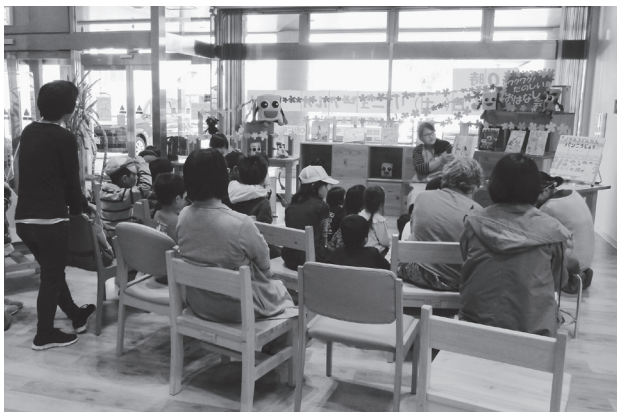
「ワクワク！たのしいおはなし会」のようす

4月3日（水）、可部自動車学校千代田交通安全センターで、高齢者講習専用コースの開所セレモニーが開催されました。同施設では、これまで町外で受講する必要があった、70歳以上が運転免許証の更新のため必要な高齢者講習を受講することができます。また、地域の交通安全教室などにも活用される予定です。