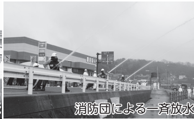
消防団による一斉放水