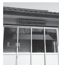
わさ環境農業公園