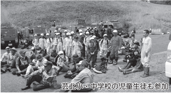
芸北小・中学校の児童生徒も参加