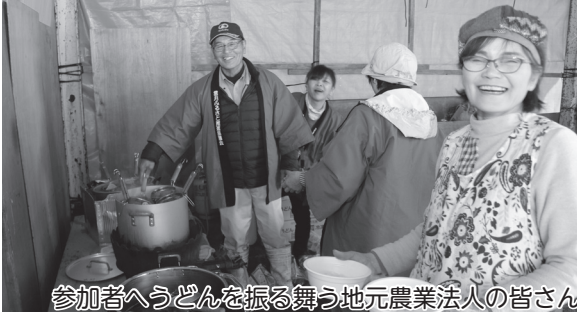
参加者へうどんを振る舞う地元農業法人の皆さん