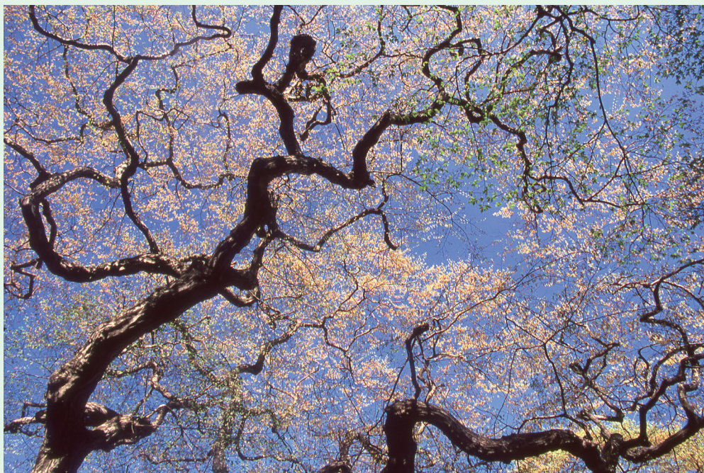
【議長賞】「輝く芽吹き」〔撮影場所：大朝地域〕

Photograph of Kitahiroshima 北広島町観光写真コンテスト入賞作品