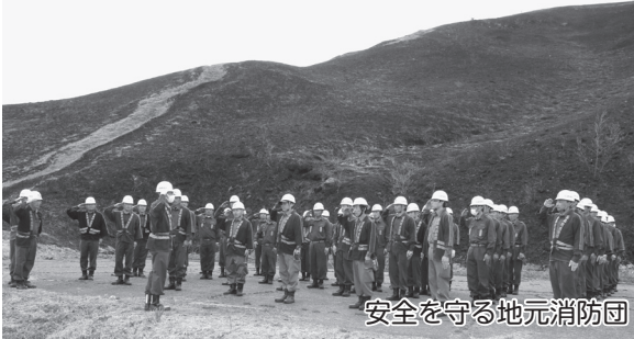
安全を守る地元消防団