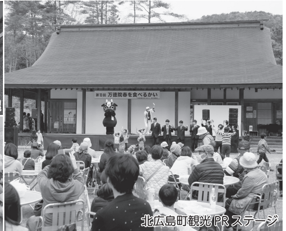
北広島町観光PRステージ

4月28日（日）、万徳院跡歴史公園（北広島町舞綱）で18回目となる「万徳院 春を食べるかい」が開催されました。