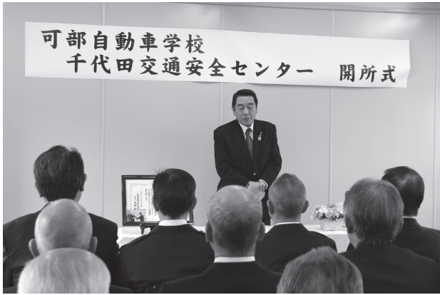
開所セレモニーであいさつする箕野町長