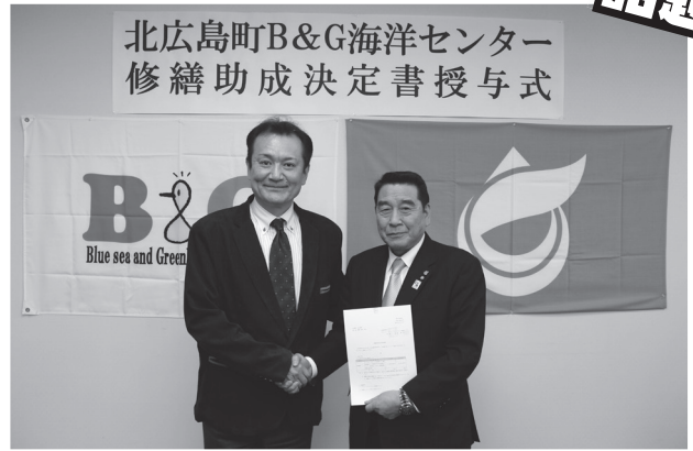
助成決定書を手渡す菅原理事長（左）と箕野町長（右）