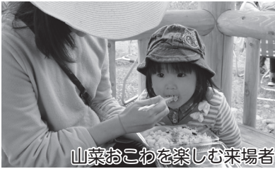
山菜おこわを楽しむ来場者