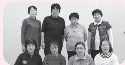
雲月元気クラブの皆さん